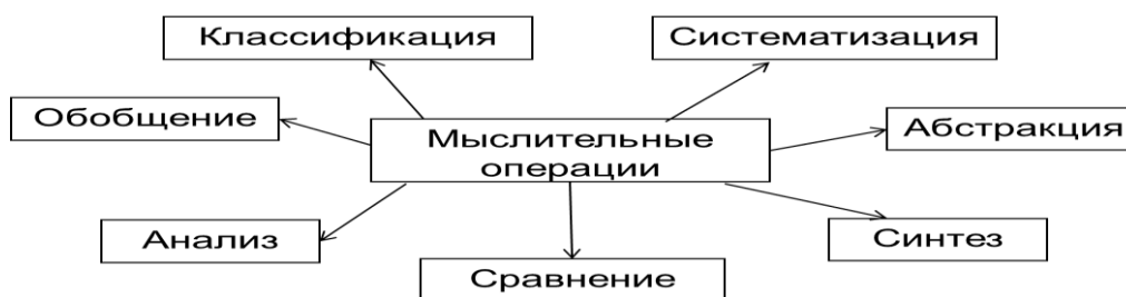
Рис. 1. Мыслительные операции по С.Л. Рубинштейну