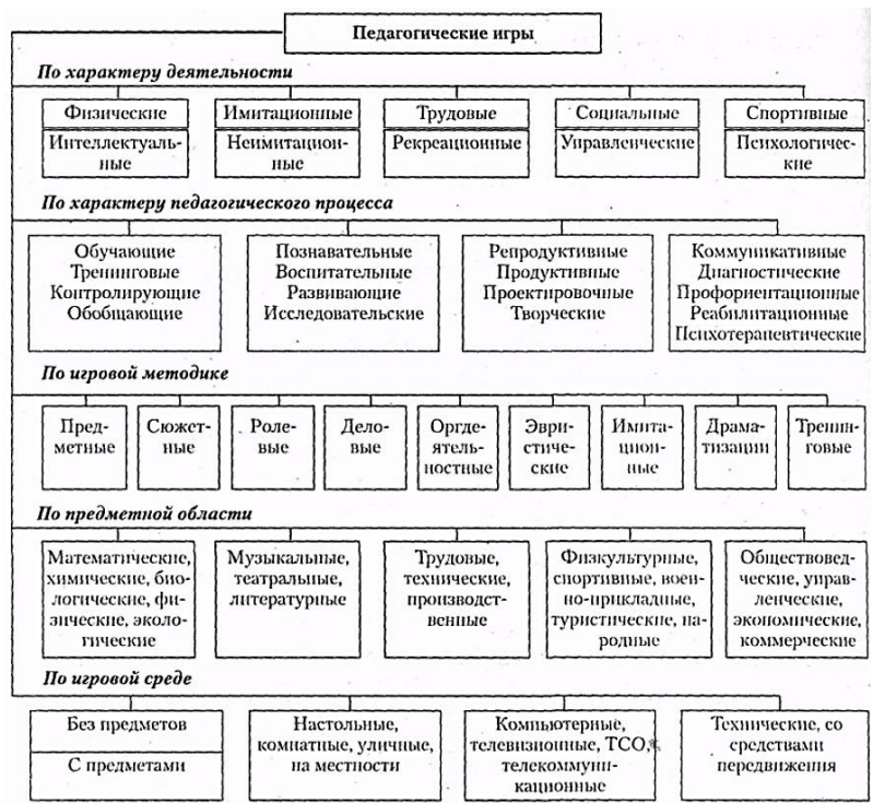
Рисунок 3 – Классификация педагогических игр по Г.К. Селевко

Место и роль игровой технологии в учебном процессе, сочетание элементов игры и учения во многом зависят от понимания педагогом функций и классификации педагогических игр (рисунок 3).