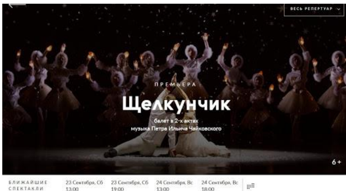
Рисунок 4 – Афиша премьеры балета «Щелкунчик»

Следующим мероприятием для посещения был концерт ко Дню независимости коммерческого хореографического коллектива «Кармельки» на площадке инстаграмм. В концертной программе были представлены номера: казахский танец «Колыбель» в исполнении смешанной группы, танцевальный номер «Зонтики» в исполнении младшей группы, «Рок-н-ролл» в исполнении средней группы и финальным номером был современный танец «Алга».