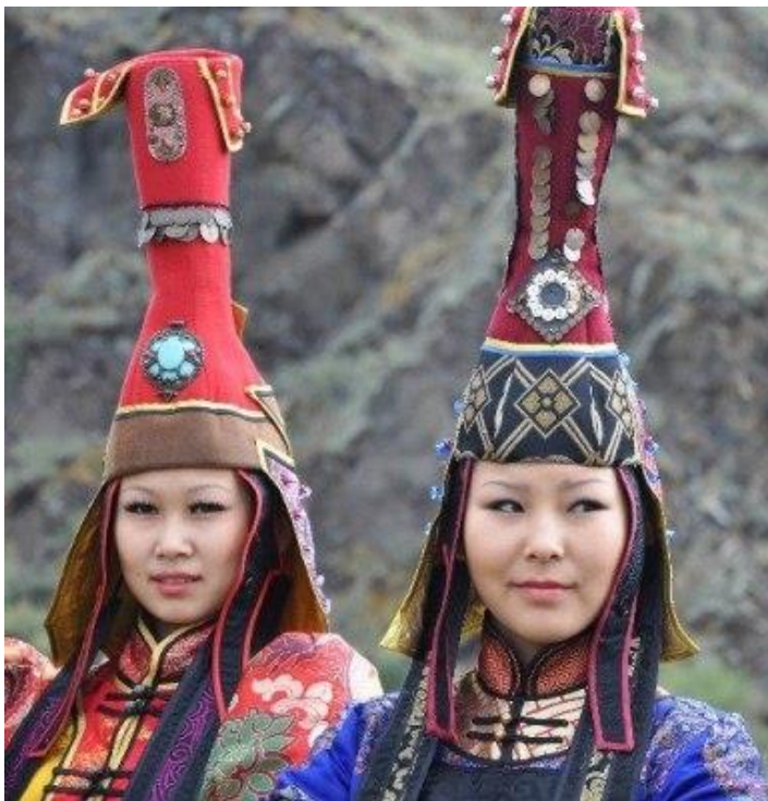
Рисунок 6 – Монгольский женский головной убор «бокка»

Говоря о различиях, на уроках ранее при постановке казахского танца, мы разбирали женские казахские костюмы, и увидели различия между женскими головными уборами. Казахский саукеле имеет форму конуса, а монгольский женские головной убор «бокка» заужен в середине возвышения. Символизирует меч и щит.