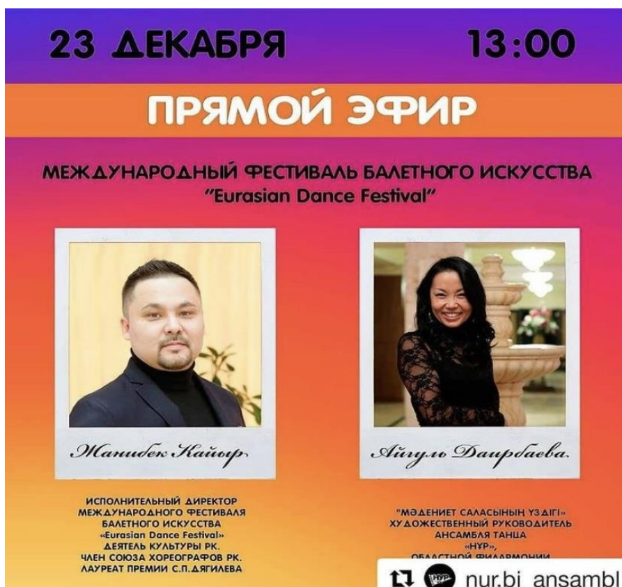
Рисунок 5 – Приглашение на прямой эфир

подобрана программа мероприятий для просмотра. После просмотра была проведена беседа на платформе зум.