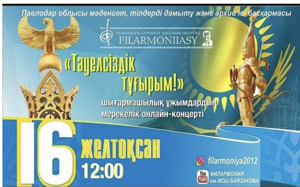
Рисунок 1 – Афиша концерта ко дню независимости

В День независимости Казахстана по всей республике проходят массовые народные гуляния. Уже сложилась традиция, в преддверии праздника награждать выдающихся граждан Казахстана – деятелей культуры, искусства, спорта, политики. Нередко объявляются «праздничные амнистии» людям, единожды преступившим закон (в основном, по неумышленным и нетяжким преступлениям, а также женщинам и несовершеннолетним осуждённым). Во многих населённых пунктах страны проводятся праздничные мероприятия и концерты. традиционными стали салюты и фейерверки в честь независимости.