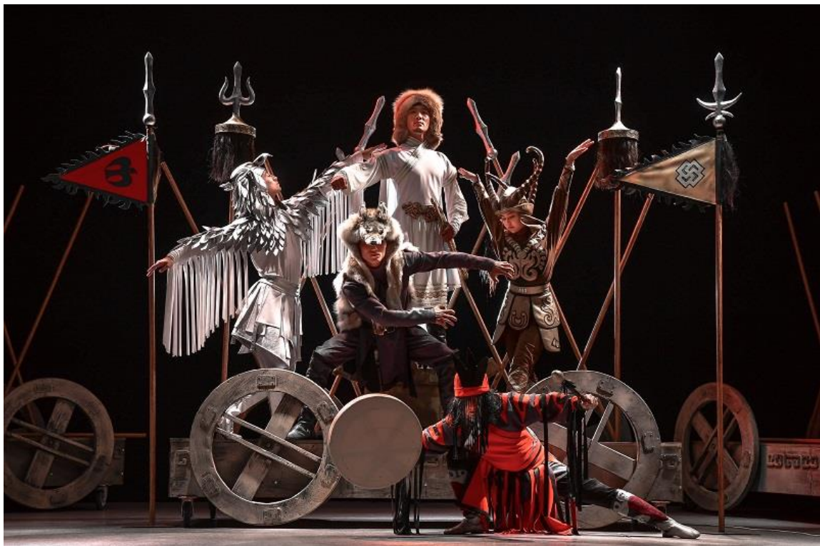
Рисунок 2 – Фото со спектакля «Чингисхан» театра танца «Наз»

Постановка посвящена жизни и подвигам Чингисхана. Чингисхан является важнейшим военным государственным деятелем своего времени. В спектакле наши отражение легенды и повести, показывая периоды детства, зрелости и провдения. На языке танца зрителям были показаны сражения, военные походы, завоевания и становление Тэмуджина в правителей обширных земель Азии Чингисхана. В профессиональном исполнении постановка погружает зрителя в атмосферу 13 века, благодаря специально написанной музыке, художественным декорациям, удивительным костюмам той эпохи.