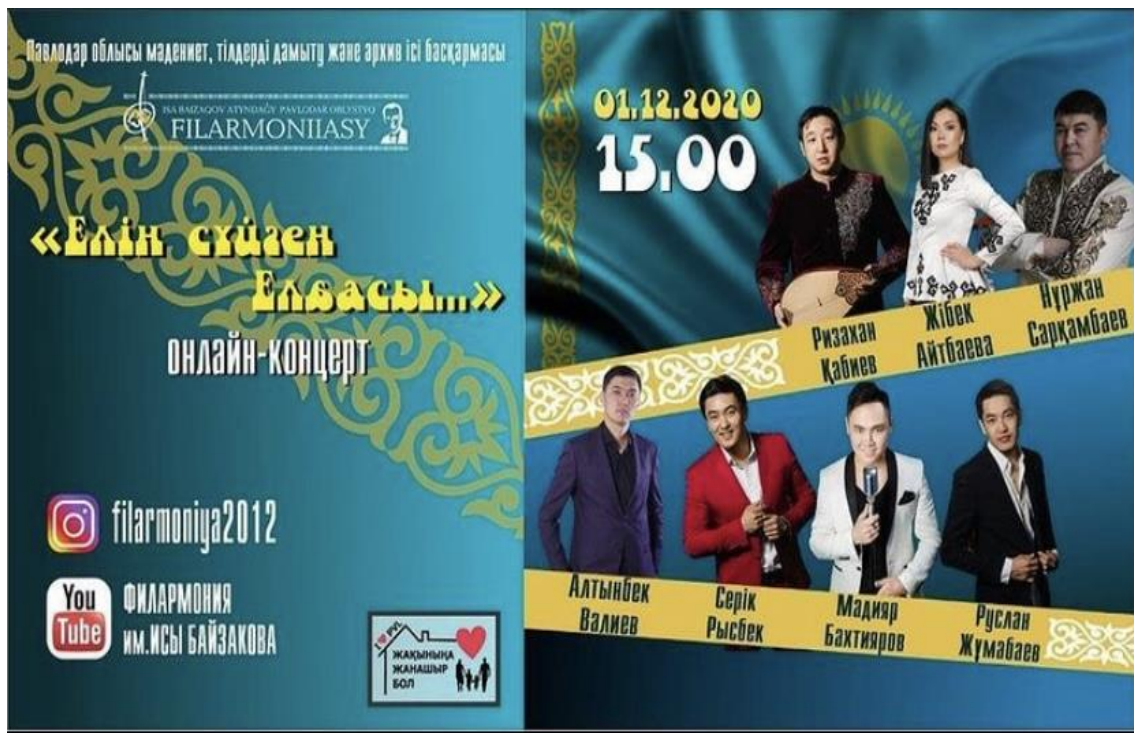
Рисунок 3 – Афиша концерта ко дню первого президента

День первого президента – день уважения заслугам Ел Басы. Праздничный концерт ко дню первого президента был более торжественным, чем концерт ко дню независимости. Слова ведущих, видео и аудио материалы были о достижениях, развитии и процветании нашего государства, о личных качествах лидера нации, о том, как он смог построить независимое государство с нуля.