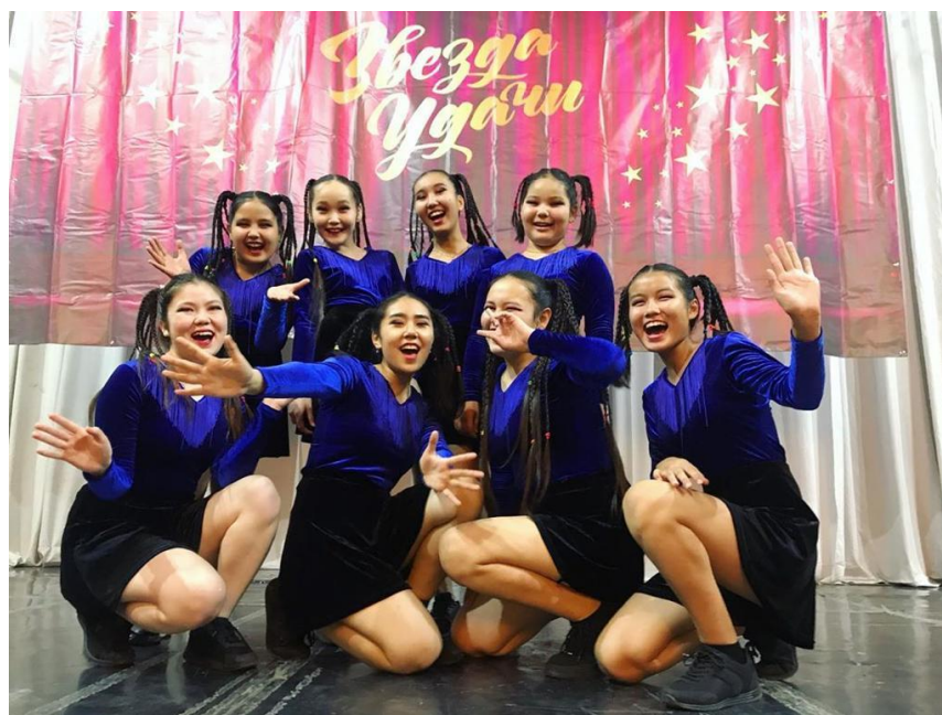
Рисунок 6 – Образцовый хореографический ансамбль «Иртыш»

В целях формирования основ эстетической культуры для проведения эксперимента была выбрана старшая группа образцового хореографического ансамбля «Иртыш». Группа состоит из 12 человек 13–16 лет. На основе анализа методической и психолого-педагогической литературы и практической воспитательной деятельности была составлена образовательная программа в онлайн формате для учеников старшей группы детского культурно-досугового центра «Колос» города Павлодар. Целью эксперимента является апробировать предложенную образовательную программу, определить эффективность и изучить эстетический вкус современных подростков нынешнего поколения.