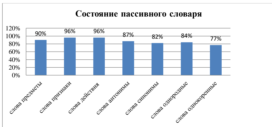
Рисунок 6 – Состояние пассивного словаря у старших дошкольников с общим недоразвитием речи III уровня

Сравнительный анализ лексики представлен на рисунке 7.