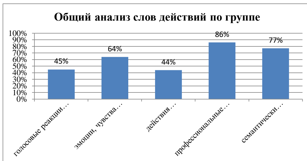
Рисунок 3 – Результаты обследования глагольного словаря

Общие результаты обследования глагольного словаря представлены на рисунке 3.