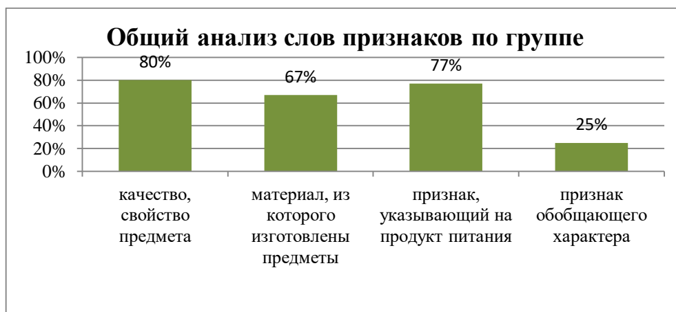
Рисунок 2 – Результаты обследования словаря признаков предметов

Результаты обследования по группе представлены на рисунке 2.