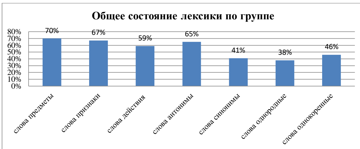
Рисунок 5 – Состояние лексики у старших дошкольников с общим недоразвитием речи III уровня

Сопоставляя количественные данные словаря дошкольников экспериментальной группы, мы обнаружили там достаточное количество слов предметов – 70% и признаков предмета – 67%, слов антонимов – 65% и слов действий предмета – 59%. Однако, в словаре детей очень мало слов синонимов – 41%, однородных слов – 38% и однокоренных – 46%.