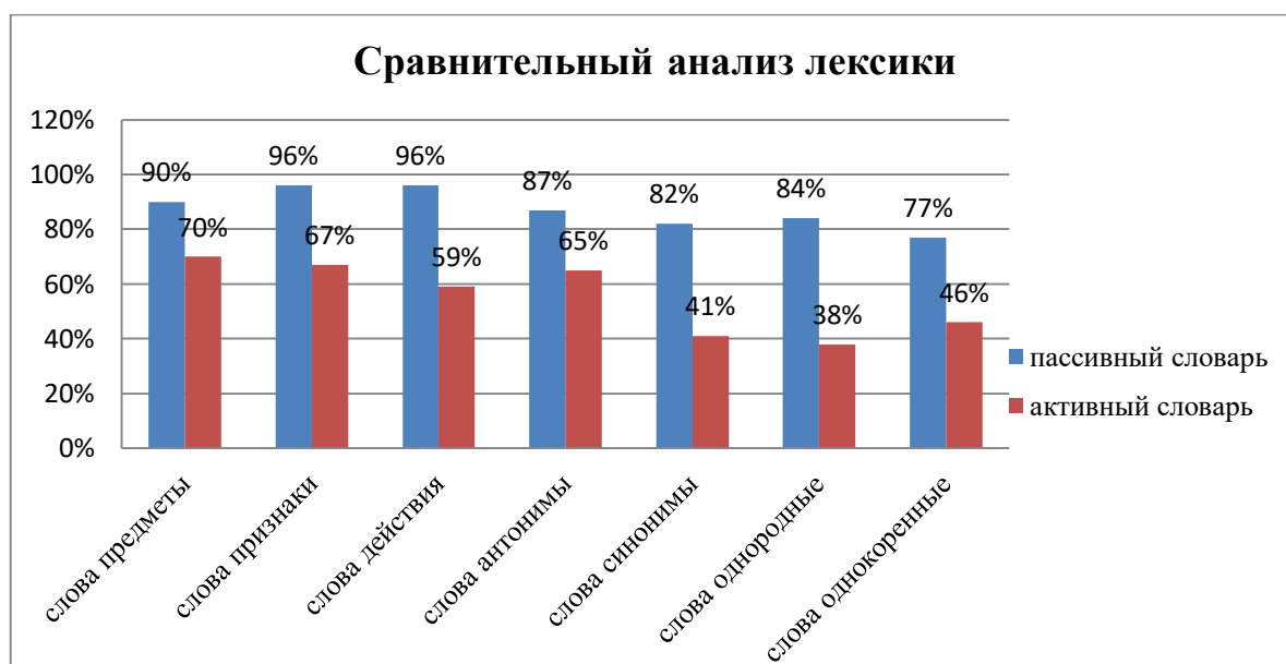
Рисунок 7 – Сравнительный анализ лексики у старших дошкольников с общим недоразвитием речи III уровня

Таким образом, при обследовании лексики нами была использована методика Г.В. Чиркиной [38]. В изучение словаря вошли: слова-предметы, слова-действия, слова-признаки, слова антонимы, синонимы, однокоренные слова и слова однородных членов предложения. При исследовании мы использовали различные диагностические приемы – это называние, подбор, выбор, добавление слов предметов, действий, качеств. Данные приемы позволили выявить количественную и качественную стороны словарного запаса у детей старшего дошкольного возраста с ОНР III уровня.