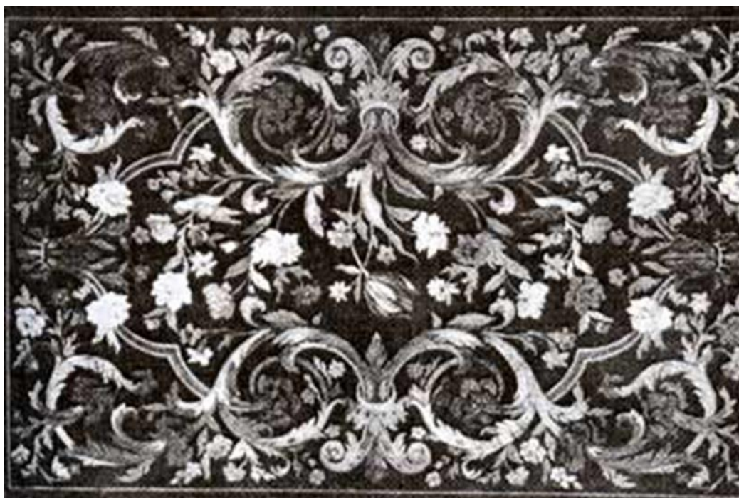
Рисунок 2 – Стили орнамента по принадлежности