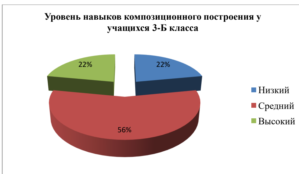
Рисунок 5 – Уровень навыков работы с орнаментом у учащихся 3 – Б класса