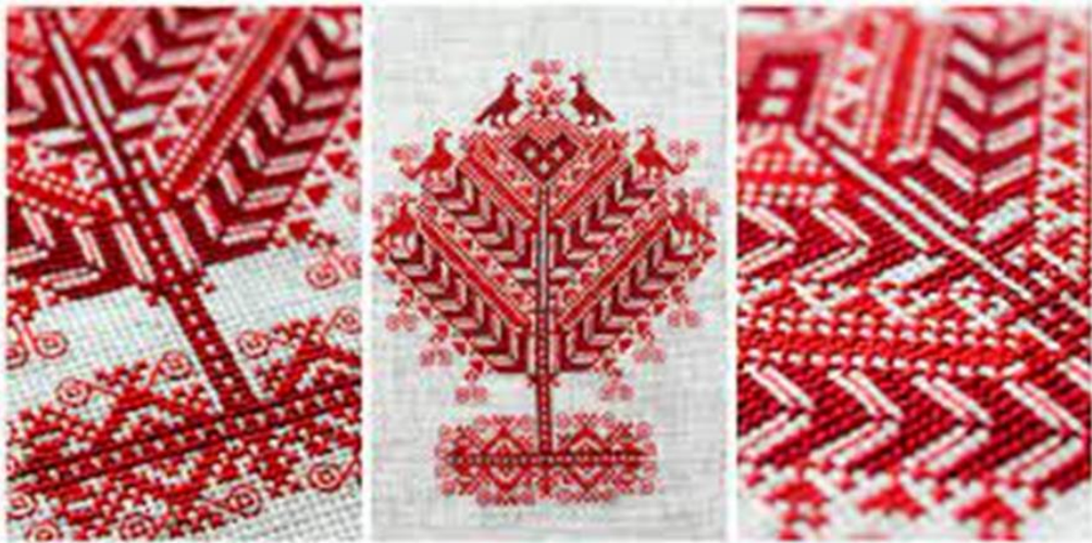
Рисунок 3 – Стили по народной принадлежности

Характеристика композиционного построение орнамента.