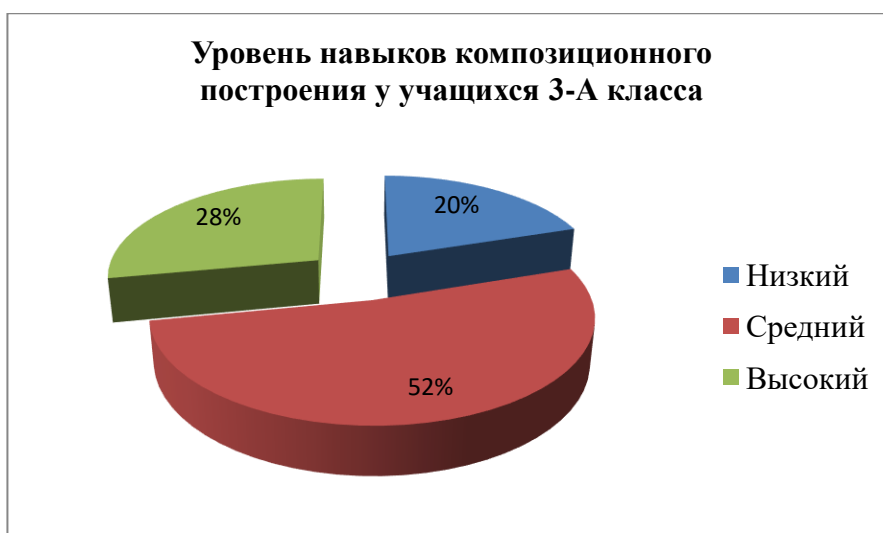
Рисунок 4 – Уровень навыков композиционного построения у учащихся 3-А класса