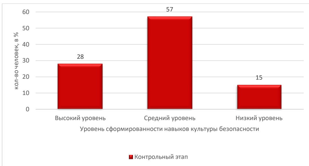
Рисунок 6 - Результаты уровня сформированности деятельностного критерия навыков культуры безопасности младших школьников по методике «Оцени поступок»

Для выявления уровней деятельностного критерия навыков культуры безопасности младших школьников методика: «Оцени поступок» (автор Э.Туриэль, мы видим результаты на рисунке 6.