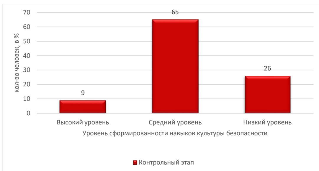
Рисунок 5 - Результаты уровня сформированности эмоционально-ценностного компонента безопасного поведения диагностики по методике «Что такое «хорошо» и что такое «плохо»

Для выявления уровней деятельностного критерия навыков культуры безопасности младших школьников методика: «Оцени поступок» (автор Э.Туриэль, мы видим результаты на рисунке 6.