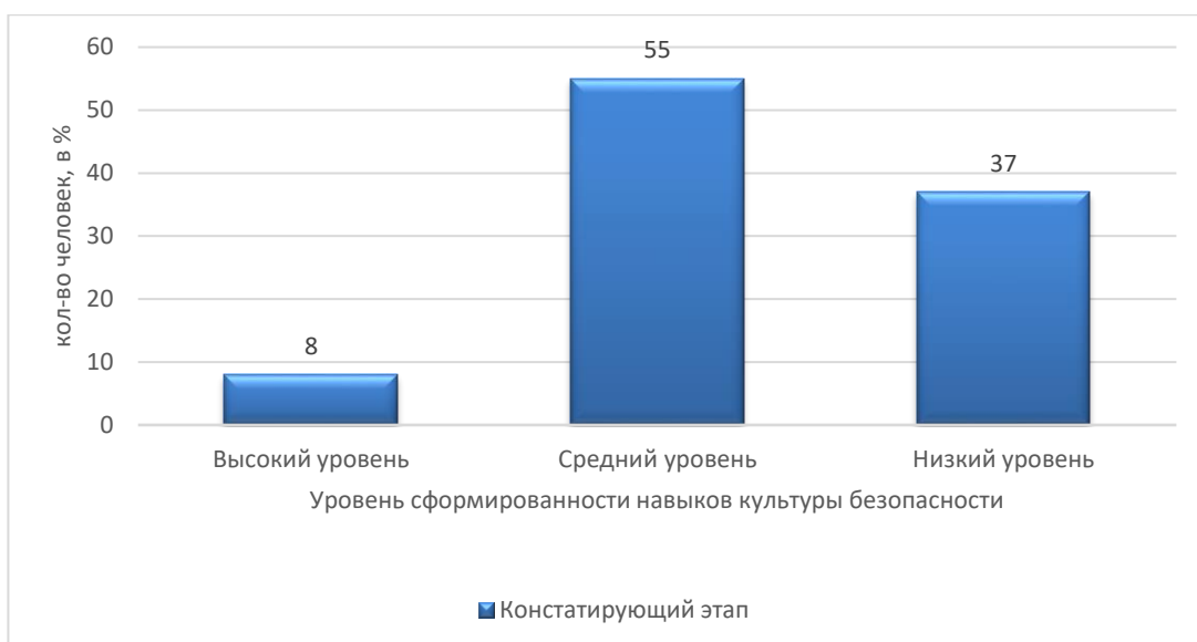
Рисунок 3 - Результаты уровня сформированности деятельностного критерия навыков культуры безопасности младших школьников по методике «Оцени поступок»

Опираясь на полученные нами результаты можно сделать вывод, Три испытуемых показали низкий уровень, половина опрошенных (5 обучающихся) показали средний уровень. И только один обучающийся смог ответить без ошибок и обосновать свой ответ.