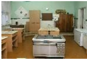
Рисунок 2. Лаборатория поваров