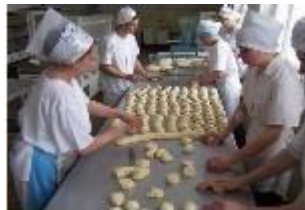
Рисунок 3. Цех по выпечке хлебобулочных изделий.

В колледже имеется необходимое оборудование и инвентарь для работы с шоколадом, карамелью, изготовлению суши. Все лаборатории отвечают санитарным требованиям.