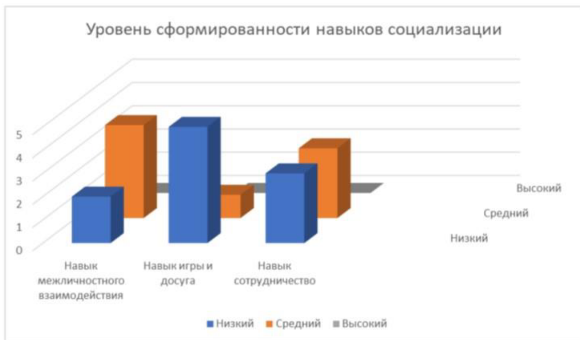
Рисунок 1 – Уровень сформированности навыков социализации по результатам констатирующего этапа эксперимента

Исходя из полученных результатов, только два воспитанника (33,3%) показали средний уровень социализации, у 4 детей (66,7%) был выявлен низкий уровень, а высокого уровня было не выявлено.