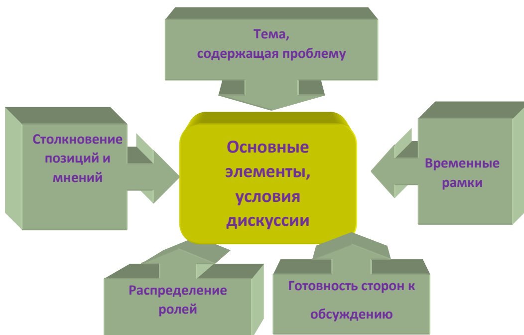
Схема 1 Основные элементы и условия проведения дискуссии