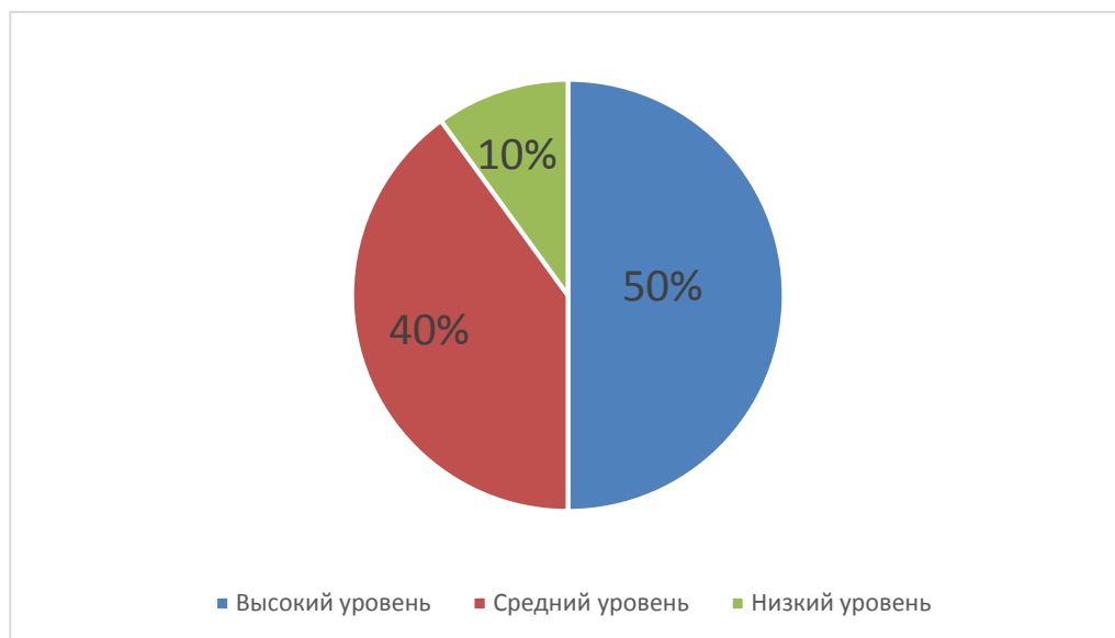
Рисунок 3 – Результаты анкетирования родителей

Далее мы провели анкетирование родителей на тему «Ребёнок и самостоятельность» и выявили, что большинство родителей считают, что их ребёнок вполне самостоятелен для его возраста. Результаты анкетирования представлены ниже (Рисунок 3).