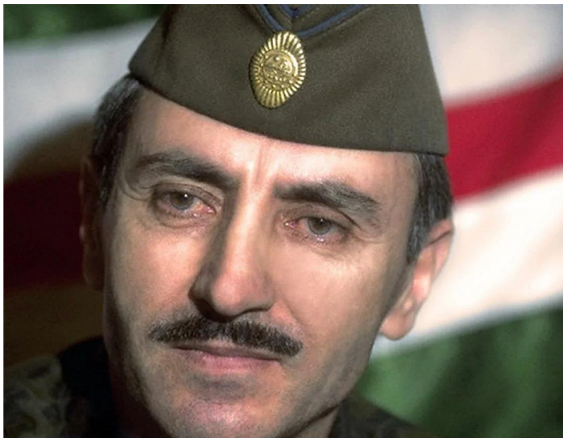
Фотография 3. Д.М. Дудаев. Первый Президент самопровозглашённой Чеченской Республики Ичкерия (1991—1996 гг.). 94