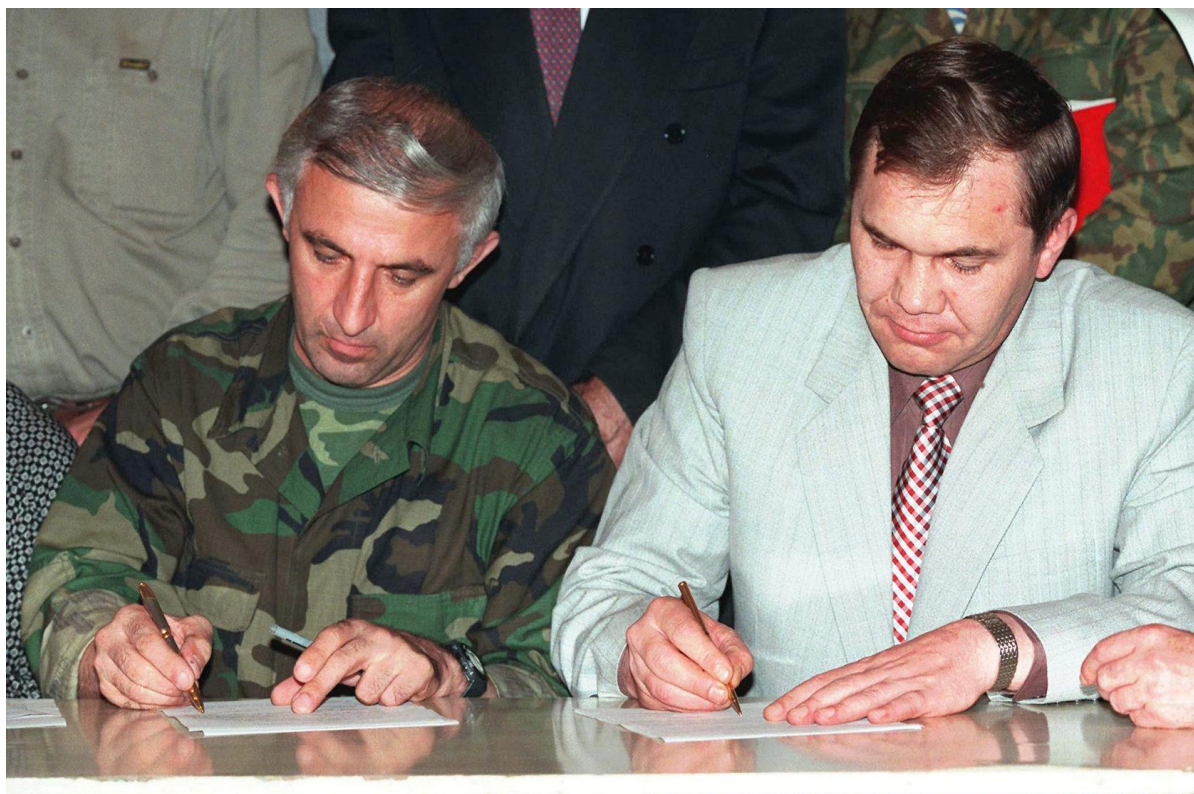
Фотография 1. Подписание А.И. Лебедем и А.А. Масхадовым Хасавюртовских соглашений 31 августа 1996 г. 92