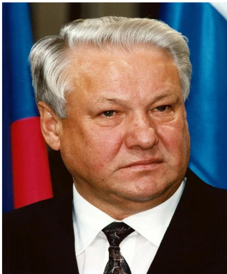
Фотография 2. Б.Н. Ельцин. Первый Президент Российской Федерации (1991—1999 гг.) 93