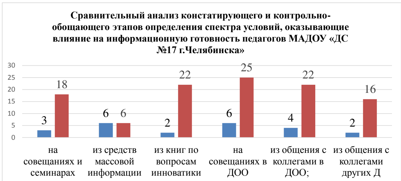
Рисунок 5 Сравнительный анализ констатирующего и контрольно-обобщающего этапов определения спектра условий, оказывающие влияние на информационную готовность педагогов МАДОУ «ДС №17 г. Челябинска»

Анализируя данные констатирующего и контрольно-обобщающего этапов определения спектра условий можно выделить влияние проведенных мероприятий по управленческому содействию развития инновационного потенциала педагогов на изменение показателей: количество педагогов, получающих информацию на совещаниях и семинарах выросло с 3 до 18