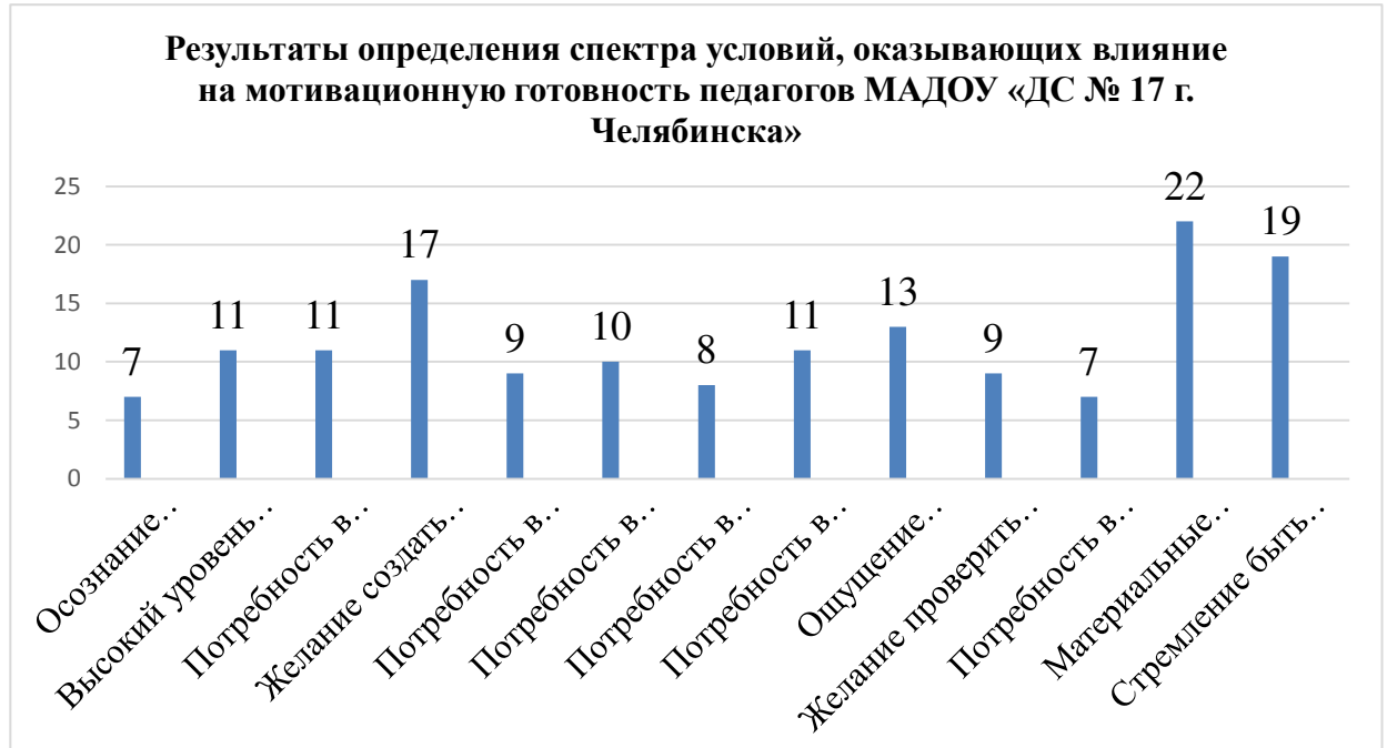
Рисунок 3 Результаты определения спектра условий, оказывающих влияние на мотивационную готовность педагогов МАДОУ «ДС № 17 г. Челябинска»

В анкетировании условий, оказывающих влияние на мотивационную готовность, на констатирующем этапе исследования были получены следующие результаты, представленные на рисунке 3.