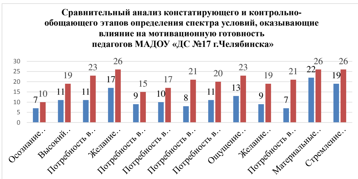
Рисунок 6 – Сравнительный анализ констатирующего и контрольно-обобщающего этапов определения спектра условий, оказывающие влияние на мотивационную готовность педагогов МАДОУ «ДС №17 г. Челябинска»

Сравнительный анализ данных анкетирования на констатирующем и контрольно-обобщающем этапах исследования (условий, оказывающих влияние на мотивационную готовность педагогов), показывает положительную динамику, представленную гистограммой на рисунке 6.