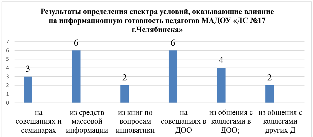
Рисунок 2 Результаты определения спектра условий, оказывающие влияние на информационную готовность педагогов МАДОУ «ДС № 17 г. Челябинска»

В анкетировании условий, оказывающих влияние на мотивационную готовность, на констатирующем этапе исследования были получены следующие результаты, представленные на рисунке 3.