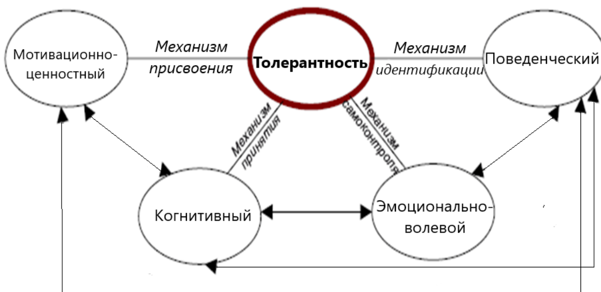
Рисунок 1 – Структурно-функциональная модель межличностной толерантности

Модель толерантности по Спицыной О.А. представлена на рис. 1, где выделены компоненты толерантности.