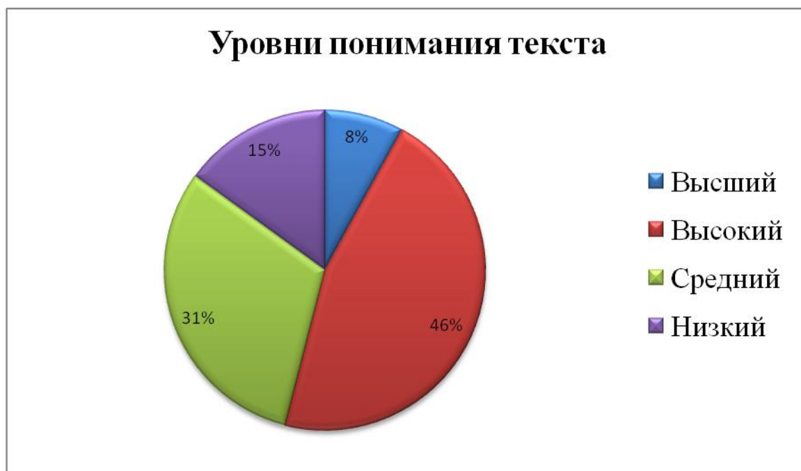
Рисунок 1 – Уровни понимания текста

Отобразим полученные данные с помощью диаграммы (рисунок 1).