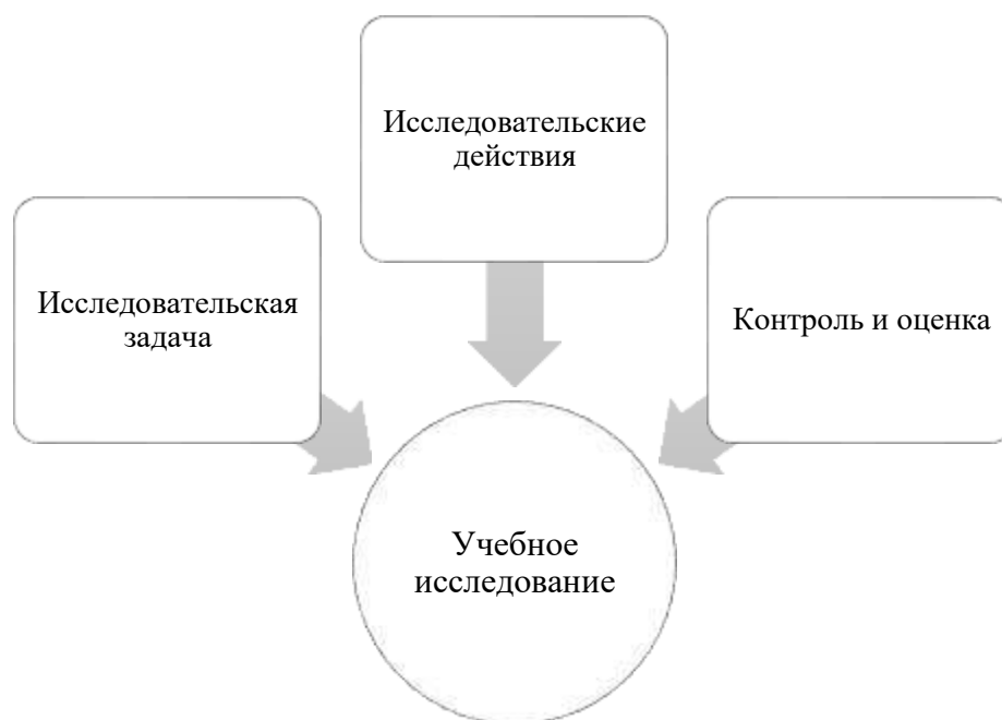
Рисунок 3 – Структура исследовательской деятельности

Структура исследовательской деятельности по В.А. Далингеру представлена на рисунке 3.