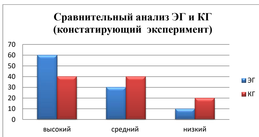
Рисунок 1 – Результаты методики «Рукавички» (констатирующий эксперимент)

20% участников эксперимента, а именно 2 пары показали низкий уровень коммуникации в сотрудничестве. В узорах явно преобладают различия, участники не смогли договориться.