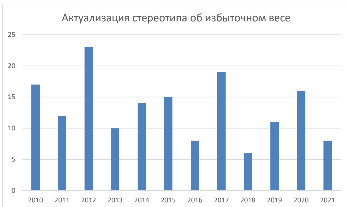
Рисунок 1 – Актуализация стереотипа об избыточном весе в англоязычном медиадискурсе