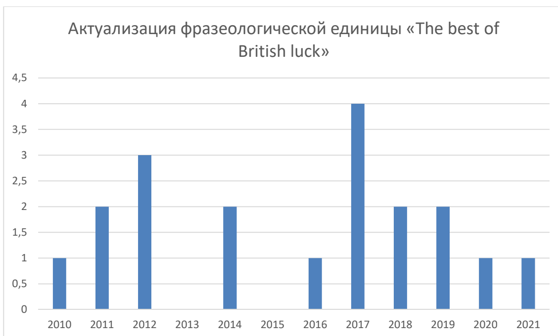
Рисунок 3 – Актуализация фразеологической единицы «The best of British luck» в англоязычном медиадискурсе