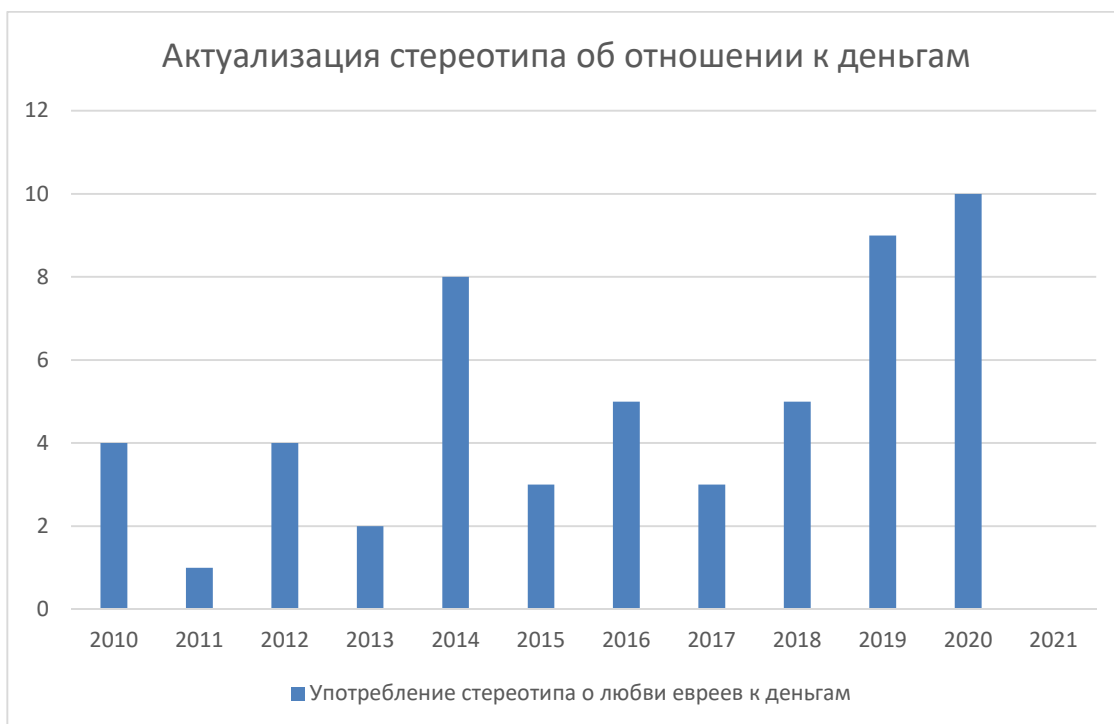
Рисунок 7 – Актуализация стереотипа об отношении к деньгам в англоязычном медиадискурсе

Нельзя сказать о том, что стереотип часто встречается в англоязычном медиадискурсе, т.к. самым большим количественным показателем за год было всего 10 контекстов в 2020 году. Все же пресса старается избегать употребления стереотипов с достаточно негативной окраской (Рисунок 7).