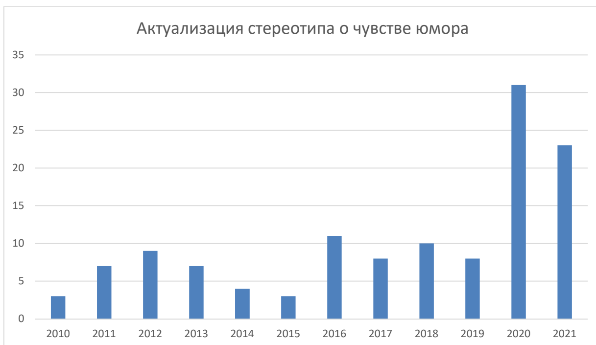
Рисунок 4 – Актуализация стереотипа о чувстве юмора в англоязычном медиадискурсе