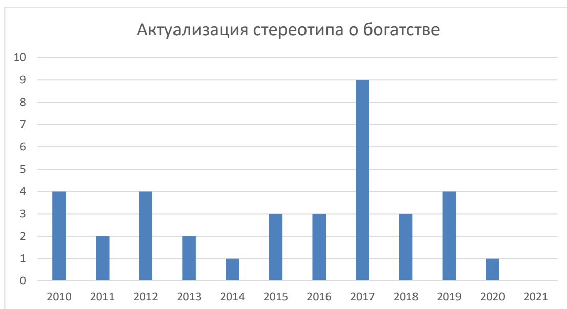
Рисунок 8 – Актуализация стереотипа о богатстве в англоязычном медиадискурсе

Употребление стереотипа о богатых евреях в СМИ стабильно на протяжении 10, 5 лет – среднее частота контекстов за год – 4 упоминания. Однако, в 2017 году вышел ряд статей в журнале «The Jerusalem Post», старающихся опровергнуть данное устойчивое мнение о еврейской нации (рис. 8)