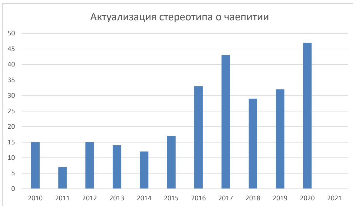
Рисунок 5 – Актуализация стереотипа о чаепитии в англоязычном медиадискурсе

Очевидно, что частота употребления «British tea» и «5-o-clock-tea» возросла за последние 5 лет. Возможно, это связано с развитием законов о рабском труде в чайной индустрии, чему посвящено множество современных статей (Рисунок 5).