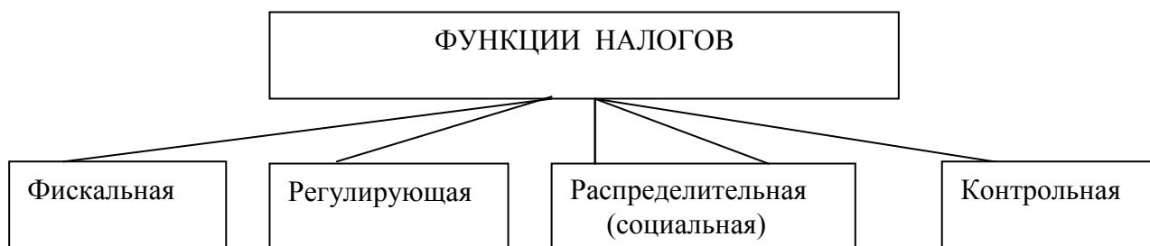
Рис.1.1. Функции налогов

– контрольная. Через налоги государство может контролировать финансовое положение организаций, источники доходов юридических и физических лиц, выявлять факты неполной или несвоевременной уплаты налогов и на этой основе разрабатывать рекомендации по совершенствованию деятельности хозяйствующих субъектов. Контрольная функция позволяет оценить эффективность каждого налогового канала, выявить необходимость внесения изменений в налоговую систему и бюджетную политику. Контрольная функция налогов проявляется лишь в условиях действия других функций налога и представлена на рисунке 1.1.