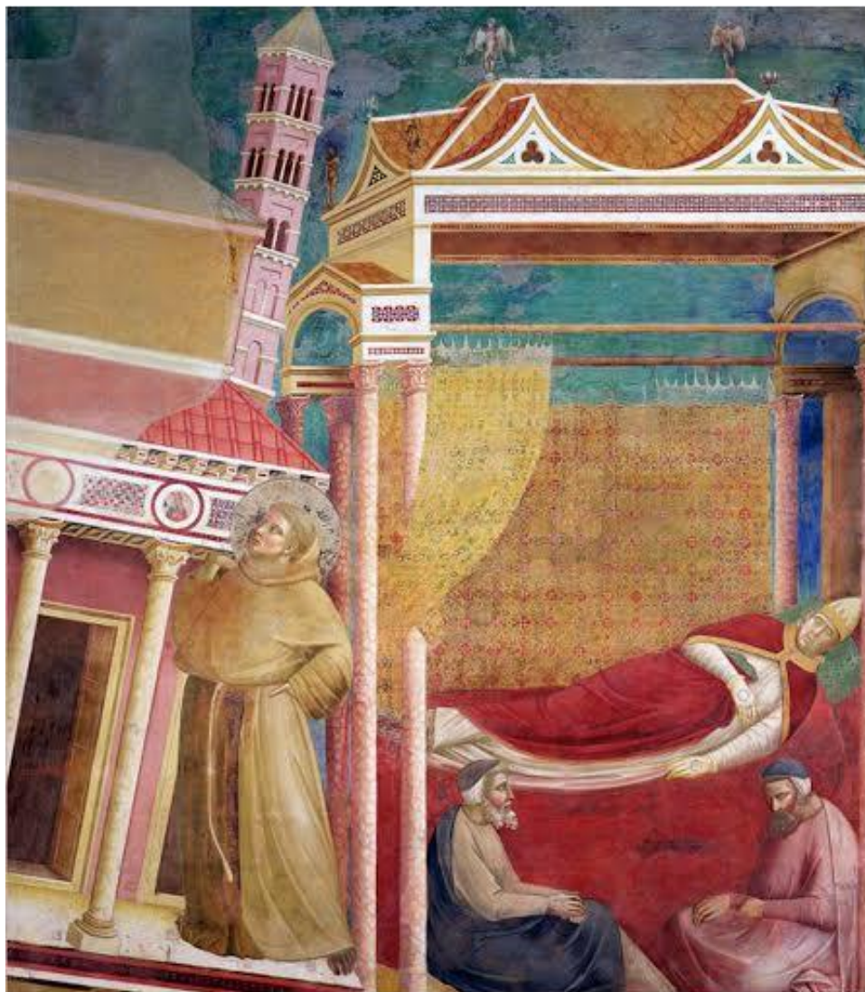
Рис. 3. Святой Франциск, поддерживающий Латеранскую базилику, и папа Иннокентий III. Ассизи, Верхняя церковь Святого Франциска

№ 7. Изучите рисунок, прочитайте текст и ответьте на вопросы.