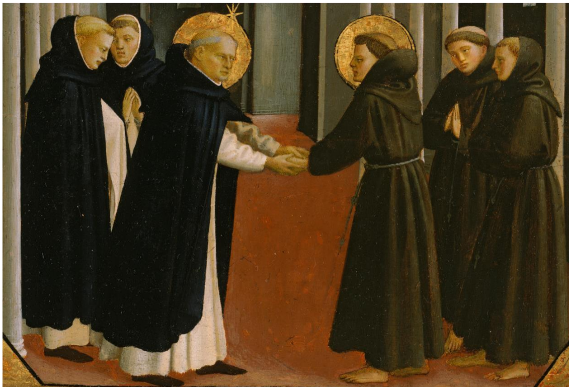
Рис. 1. Встреча святого Доминика и святого Франциска Ассизского

№ 5. Изучите рисунок, ответьте на вопросы и выполните задание.