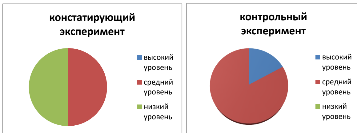
Рисунок 1 – Результаты сравнения по методике 1

Анализ исследования результатов сравнения по методике 1 – выполнение поручений, отмечены на рисунке 1.