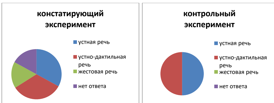
Рисунок 3 – Результаты сравнения по методике 3

Анализ исследования результатов сравнения по методике 3 – оценка активного словаря, отмечены на рисунке 3.