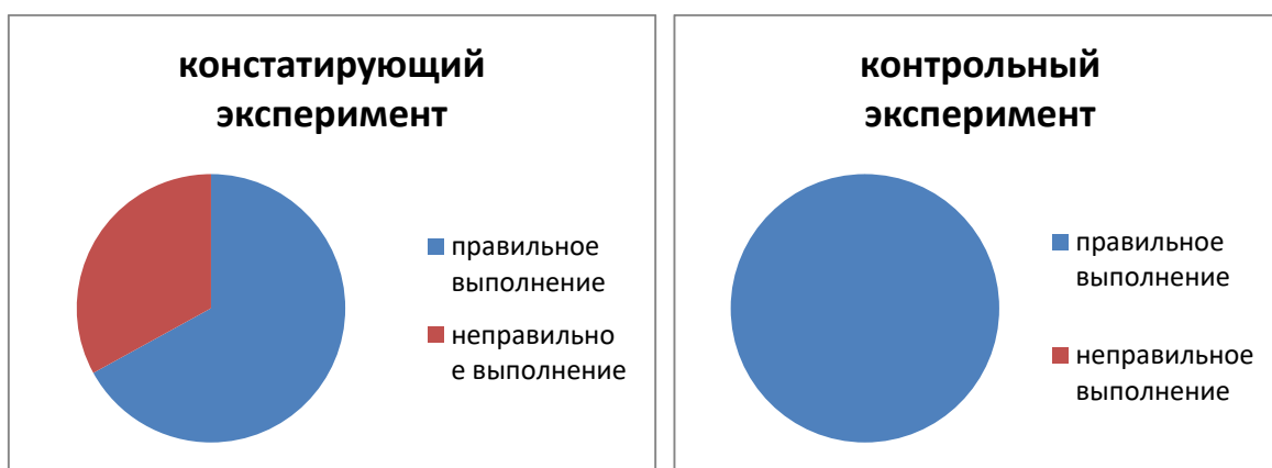
Рисунок 4 – Результаты сравнения по методике 4

Анализ исследования результатов сравнения по методике 4 – оценка пассивного словаря, отмечены на рисунке 4.