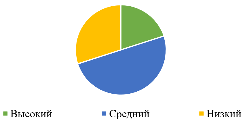
Рисунок 3 – Показатель развития технических навыков лепки у детей младшего дошкольного возраста