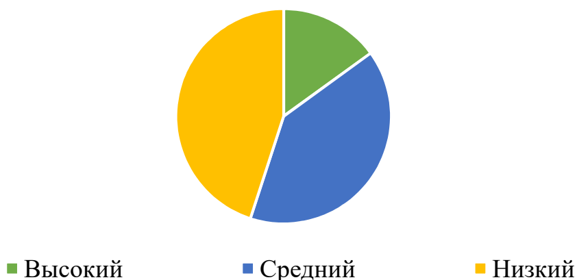
Рисунок 1 – Показатель развития технических навыков лепки у детей младшего дошкольного возраста

передана точно, во время лепки бублика – части расположены верно. Дети адекватно реагировали на замечания взрослого, стремились исправить ошибки. Оценка ребенком, созданного им изображения адекватна. Они ярко проявляли эмоциональное отношение к деятельности и предложенному заданию. Без помощи педагога самостоятельно выполняли задания. В случае необходимости обращались с вопросами. В изделиях прослеживалась самостоятельность замысла.