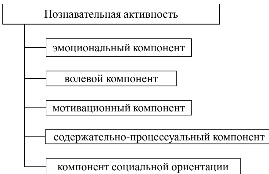
Рис. 4. Структура познавательной активности

Анализ литературы позволил выделить следующие компоненты познавательной активности (Рис. 4).