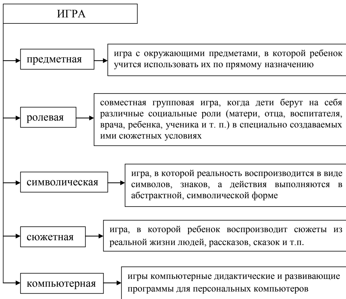
Рис. 1. Классификация игр

В педагогике различают следующие виды игр (Рис. 1):