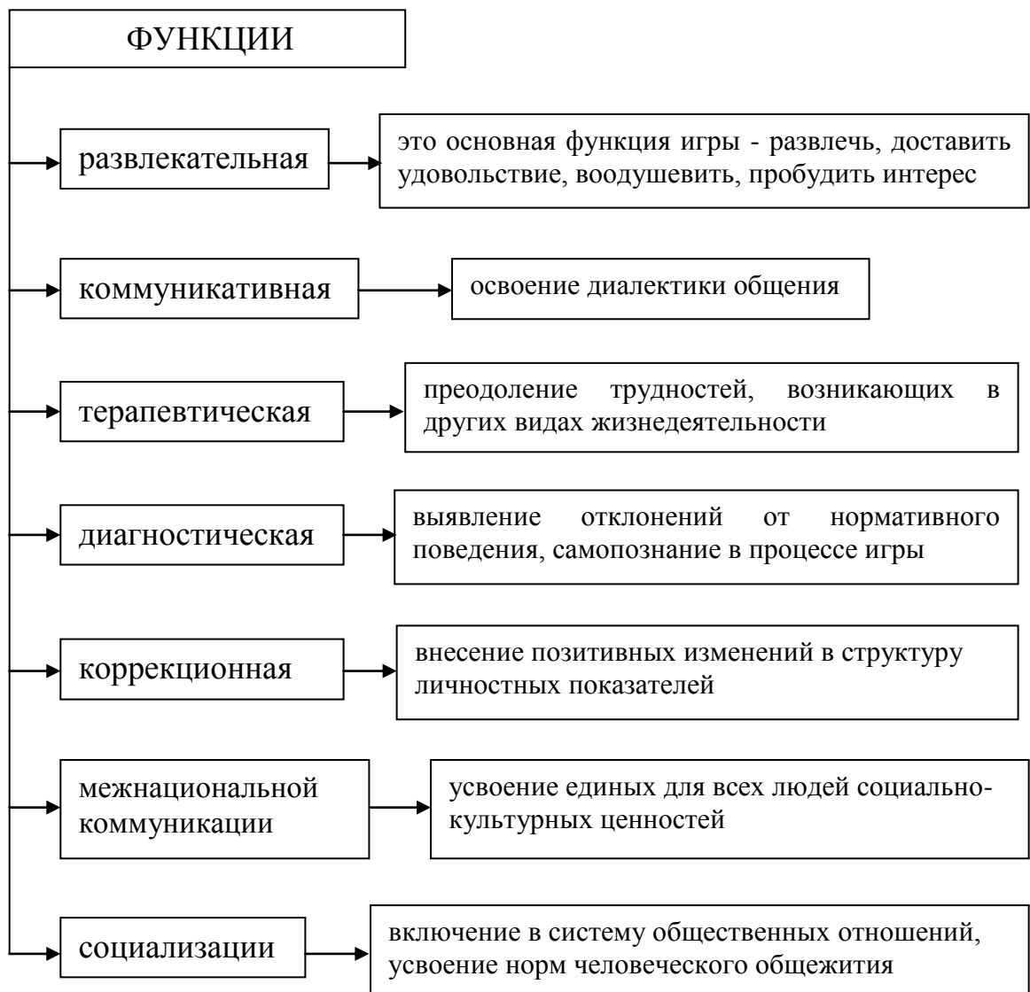
Рис. 2. Функции игровой деятельности

Перечислим основные функции игровой деятельности (Рис. 2).