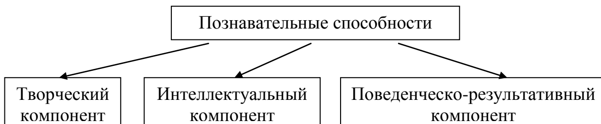
Рис. 5. Составляющие познавательных способностей

Познавательные способности детей старшего дошкольного возраста являются интегрированным типом способностей. Схематично эту систему можно представить так (Рис. 5)