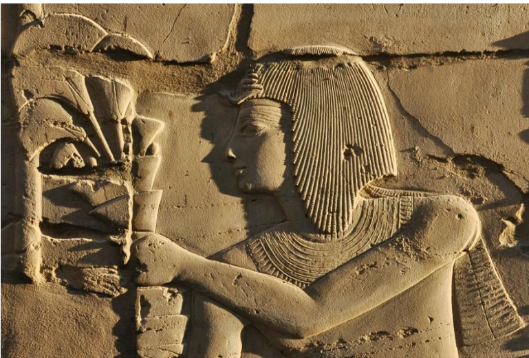
- Древний барельеф