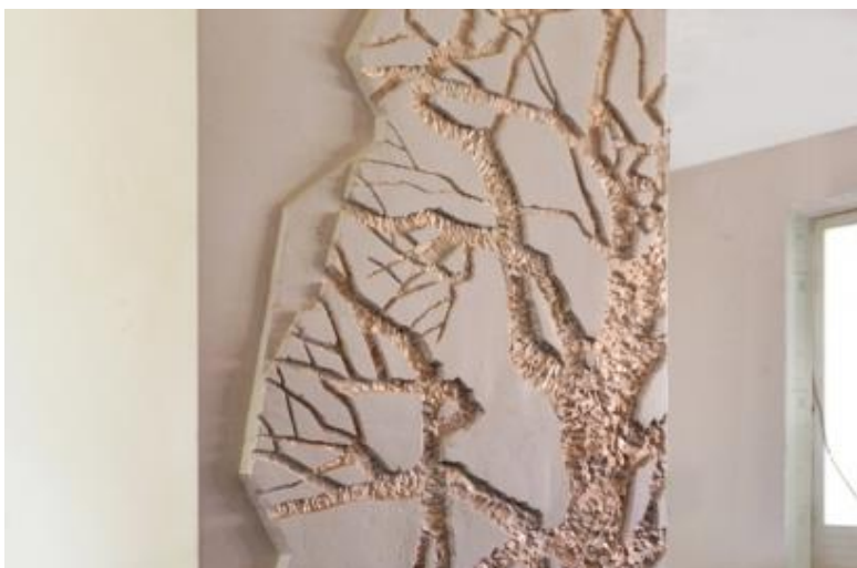
- Современный контррельеф