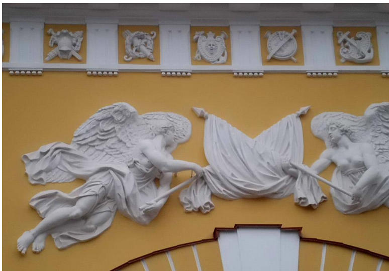
- Современный горельеф