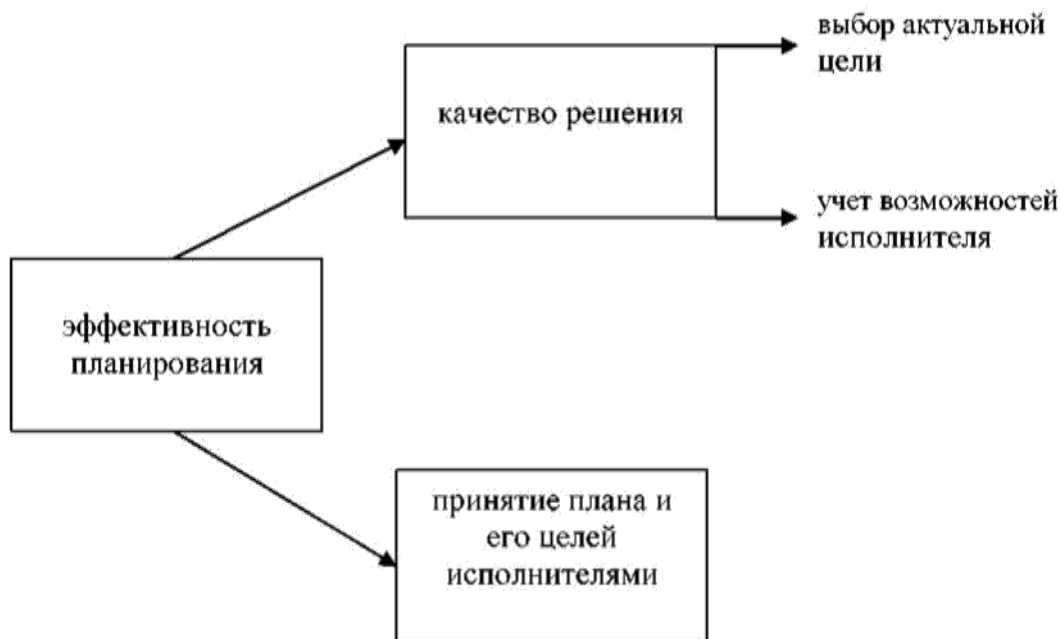
Рисунок 1 - Эффективность планирования

На качество решения будет оказывать влияние выбор наиболее актуальной цели для данной академической группы, учет возможностей студентов, которые будут реализовывать мероприятия составленного плана.