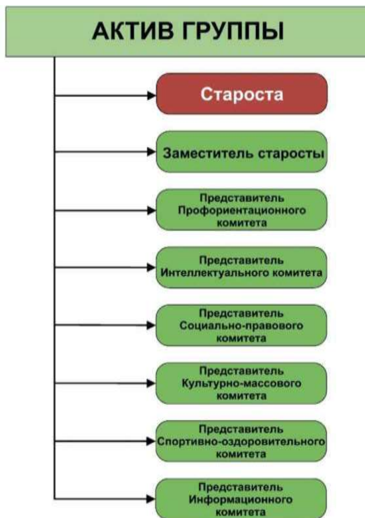
Рисунок 2 - Схема структуры актива группы