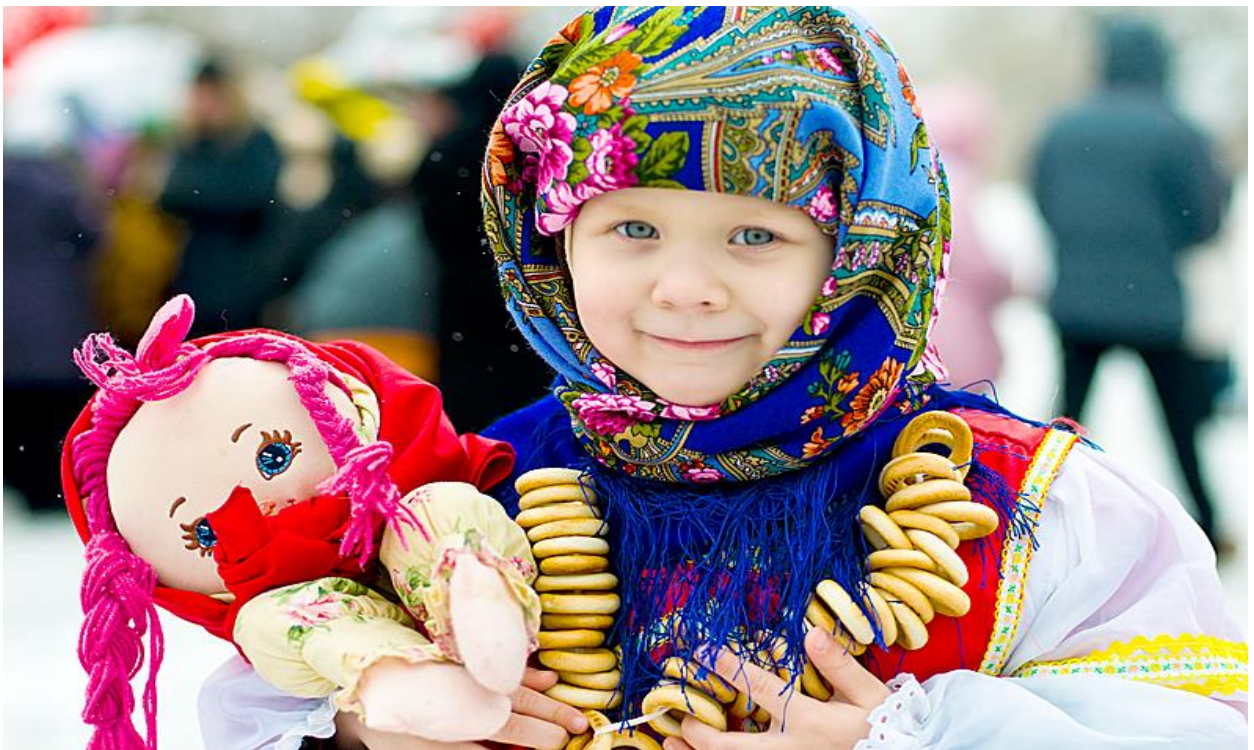
Рисунок 2, 3 – Дети в праздничных костюмах