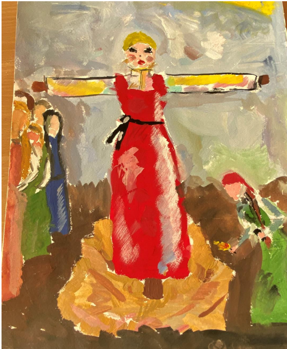
Рисунок 9 – Сжигание чучела Масленицы