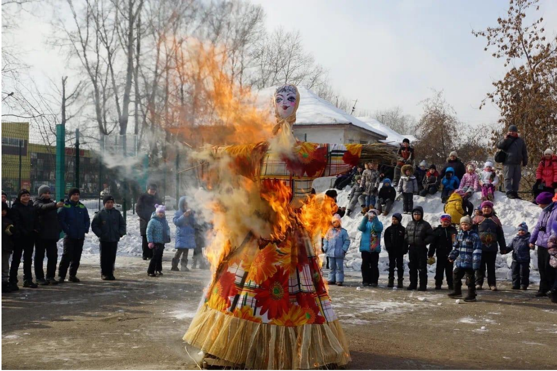
Рисунок 4 – Сжигание чучела масленицы