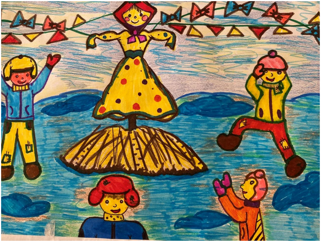
Рисунок 10 – Широкая Масленица