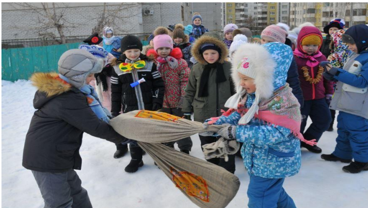
Рисунок 1 – Проведение конкурса