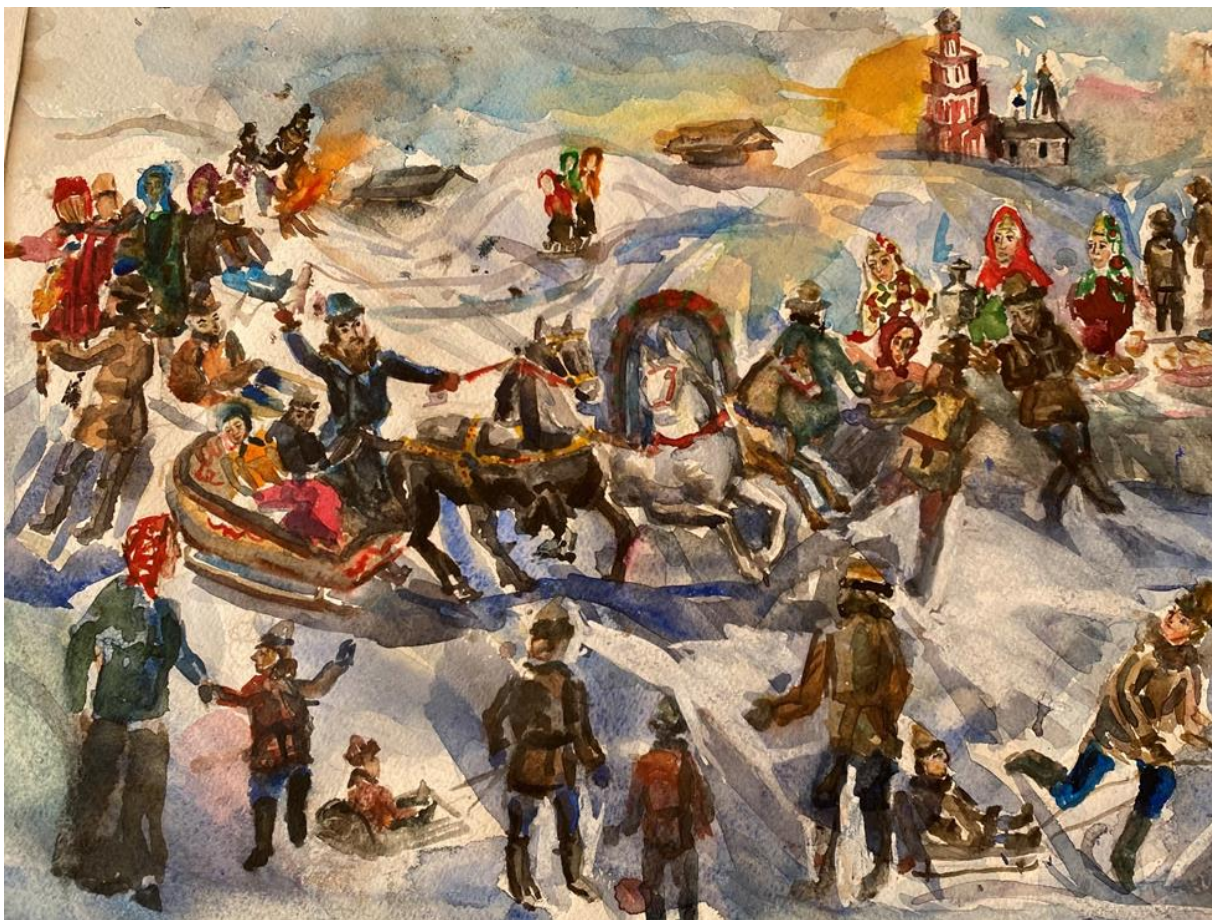
Рисунок 7, 8 – Празднование масленицы