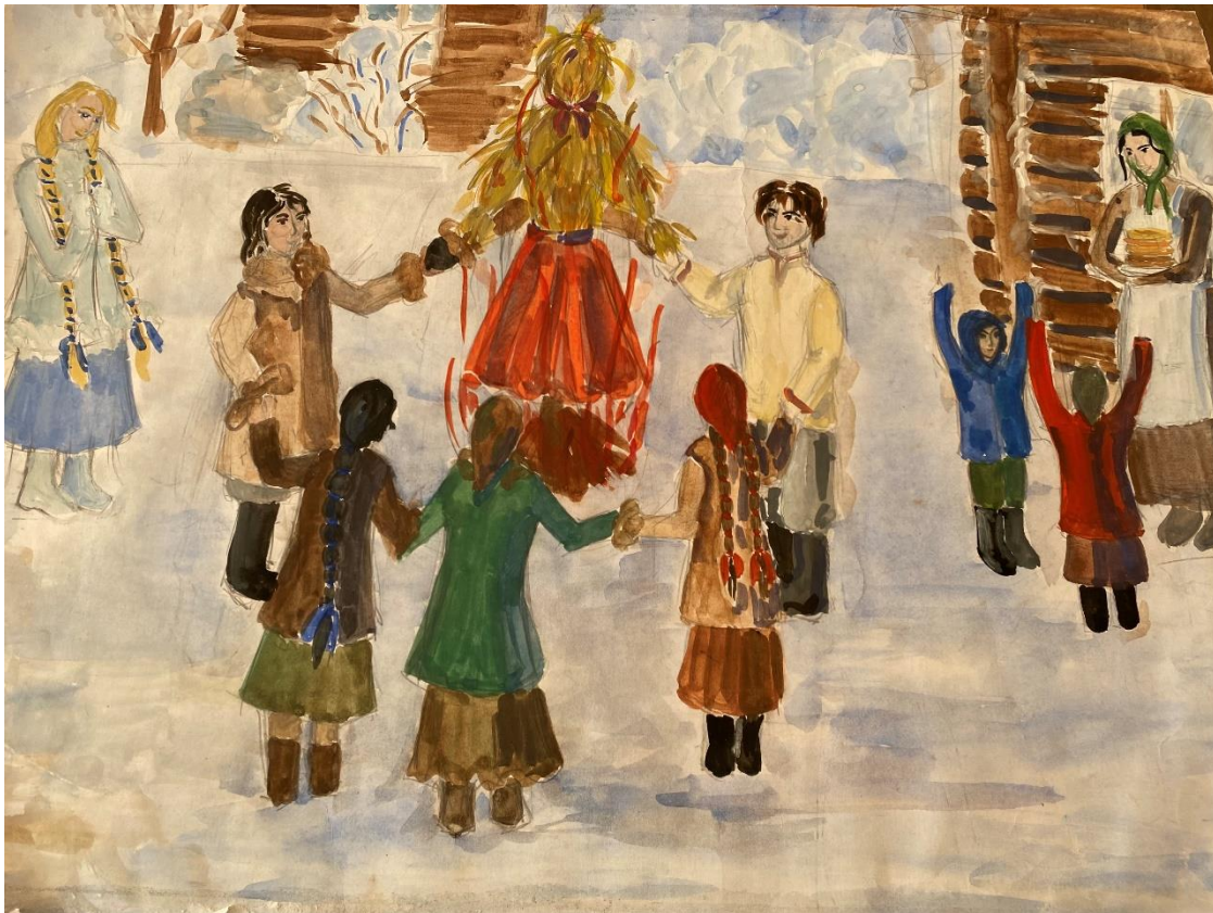
Рисунок 5, 6 – Празднование масленицы.