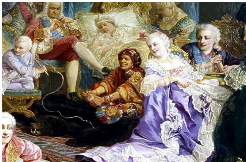
Рис. 22. Утро Анны Иоанновны.

Анна Иоанновна послала к Эйлеру приказание составить гороскоп новорожденному, – писал Пушкин в подборке исторических анекдотов «Застольные беседы». – Эйлер занялся гороскопом вместе с другим академиком. Они составили его по всем правилам астрологии, как добросовестные немцы, хотя и не верили ей. Заключение, выведенное ими, испугало обоих математиков, и они послали императрице другой гороскоп, в котором предсказывали новорожденному всякие благополучия».