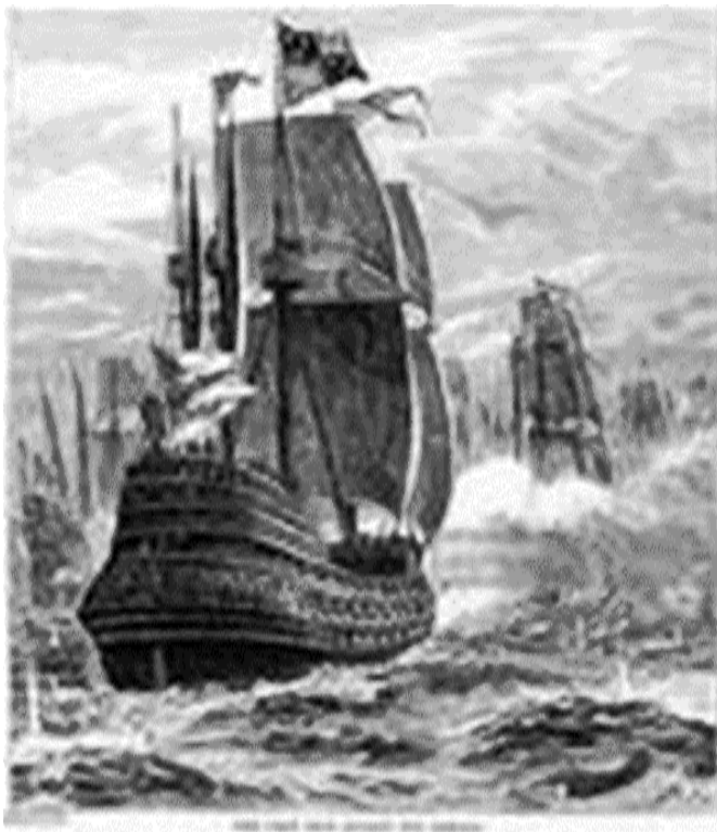
Рис. 5. Корабль «Слава России»

была создана Воинская морская комиссия. В нее вошли: А. Остерман, Н. Сенявин, Н. Головин, Т. Сандерс, П. Бредаль, В. Дмитриев-Мамонов. Был утвержден флотский бюджет – 1 миллион 200 тысяч рублей, сумма по тем временам совершенно огушительная [26].