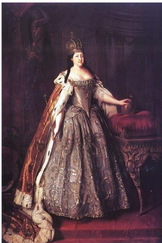
Рис. 3. Императрица Анна Иоанновна Картина Луи Каравака 1730 г. Масло, холст. Государственная Третьяковская галерея

Вектор новой политики был задан чётко. Все Петра Великого недоконченные проекты Анна старалась претворить в действительность самым тщательным образом.