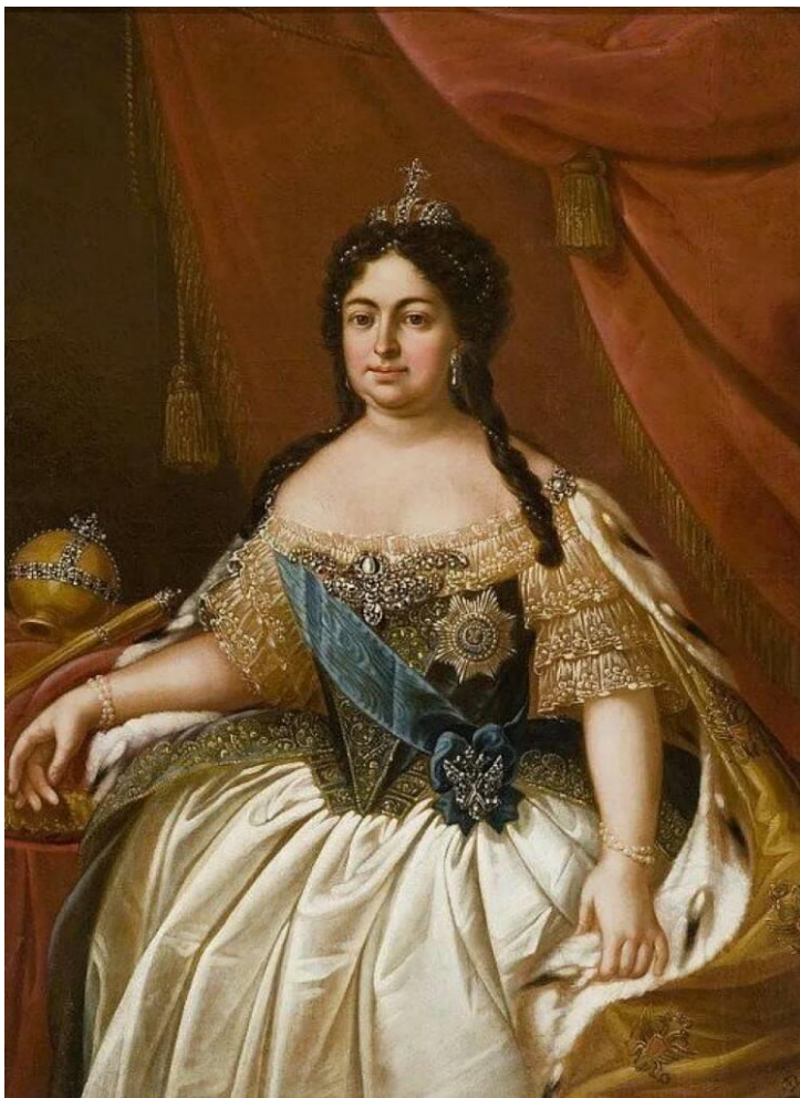
Рис. 2. Анна Иоанновна 1730 г. Неизвестный художник