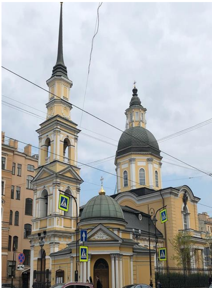
Рис. 10. Церковь Св. Симеона и Анны, личная церковь Анны Иоанновны Архитектор М. Земцов