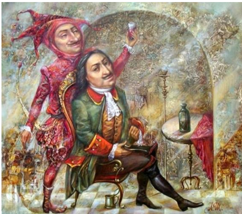
Рис. 19. Шуты Анны Иоанновны. Художник неизвестен

Что касается личных качеств, то Анну Иоанновну отличали живость характера и склонность к развлечениям. Судя по сохранившейся переписке, Анна Иоанновна представляла собой классический тип барыни-помещицы. Она любила быть в курсе всех сплетен, личной жизни подданных, собирала вокруг себя много скоморохов, рассказчиц, шутов и болтушек, которые потешали её, а также различных калек и уродцев.