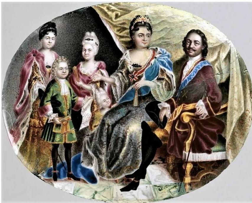
Рис. 1. Петр Первый с дочерьми Анной, Елизаветой, Натальей и внуком Петром Картина худ. Г.С. Муסיкийского, 1720-е годы

Покойный император Петр I был уверен, что его власть и престол прочно закреплены только за его потомками.