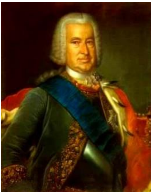
Рис. 18. Эрнст-Иоган Бирон Художник Шорер. 1760 г. Холст, масло. Рундальский дворец. Латвия

Он обожал лошадей, имел свою богатейшую конюшню на набережной Мойки и любил проводить свободное время в манеже, упражняясь в верховой езде.