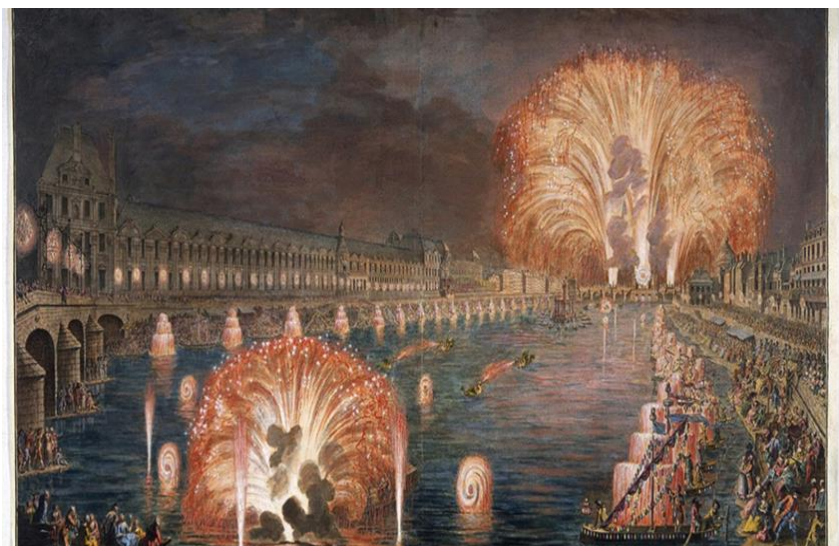
Рис. 20. Фейерверки на берегу Невы

Еще до отъезда в Питер Анна приказала привести к ней моравскую ворожею, обладавшую невероятной прозорливостью. Ворожея говорила о будущем царствовании и что императрица Анна Иоанновна просияет над Россией словно солнышко.