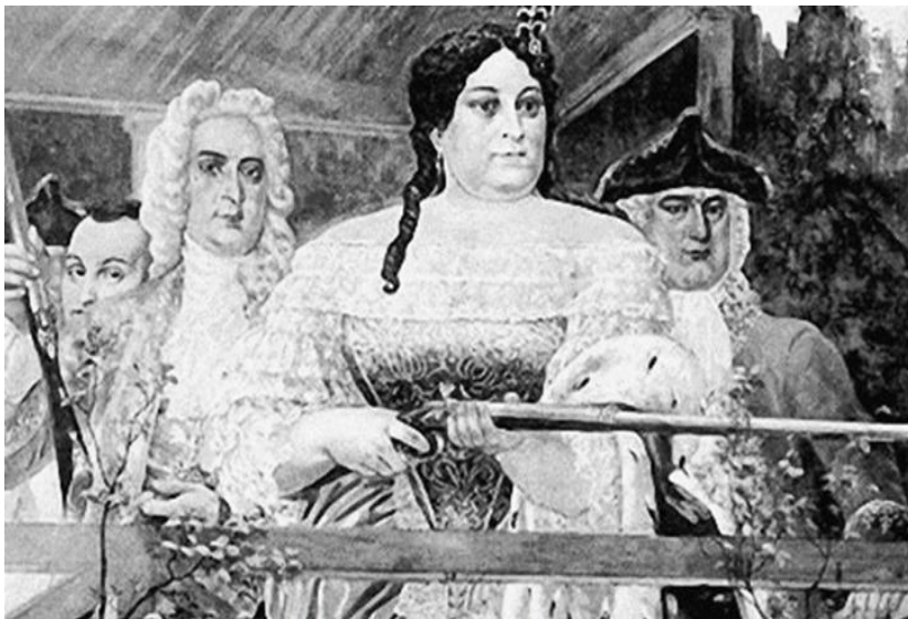
Рис. 19. Императрица Анна Иоанновна в Петергофском зверинце на охоте. Картина Андрея Рябушкина

своим фрейлинам. После того, как служанки вскакивали с кровати, она велела им петь. Фрейлины развлекали Анну Иоанновну до тех пор, пока она не приказывала закончить. Иногда императрица вызывала к себе охранников и их жён, чтобы те водили хороводы.