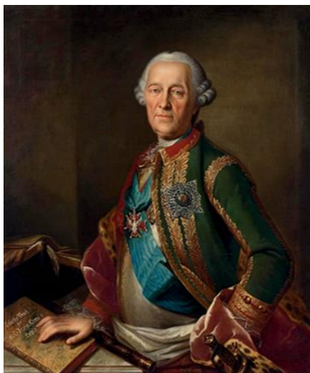
Рис. 9. Генерал Миних

Для Русско-турецкой войны 1737 повод дала Анна Иоанновна. Желая наладить отношения с Персией, Анна передала ей в управление прикаспийские земли. Крымский хан, узнав об