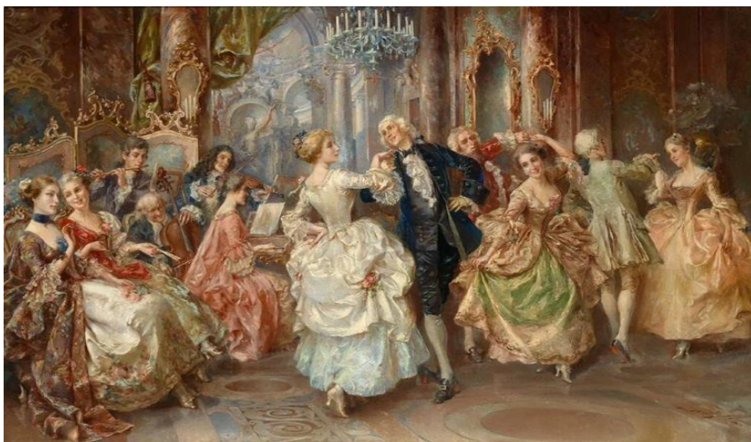
Рис. 20. Бал у Анны Иоанновны Художник неизвестен

было уже около 100, они восхищали своей красотой – золоченые, обтянутые бархатом. Она положила начало традиции проводить балы, приуроченные к памятным датам, например, был бал в честь ордена Андрея Первозванного. Иностранцы поражались роскоши ее двора и балов. Жена английского резидента леди Рондо приходила в восторг от великолепия придворных праздников в Санкт-Петербурге, переносивших ее своей волшебной обстановкой в страну фей и напоминавших ей шекспировский «Сон в летнюю ночь». Ими восхищались и избалованный маркиз двора Людовика XV де ла Шетарди, и французские офицеры, взятые в плен под Данцигом.