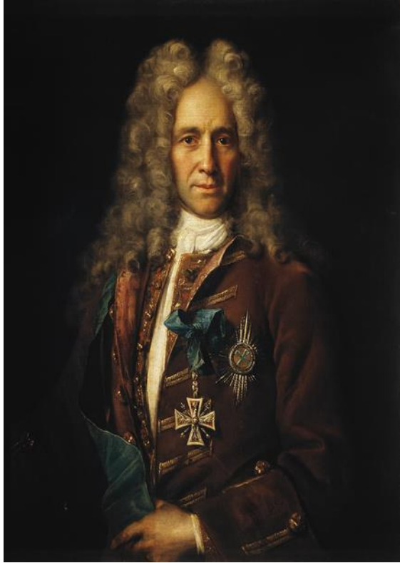
Рис. 13. Г.И. Головкин. Картина художника И. Никитина Масло, холст. Москва, Третьяковская галерея

Никитин является одним из первых русских художников, отошедших от традиционного иконописного стиля русской живописи и начавших писать картины с перспективой, так как в это время писали в Европе. Судьба первого русского художника оказалась трагической. Во времена Анны Иоанновны Никитин был арестован, 5 лет провел под следствием, затем был сослан и умер, возвращаясь из ссылки.