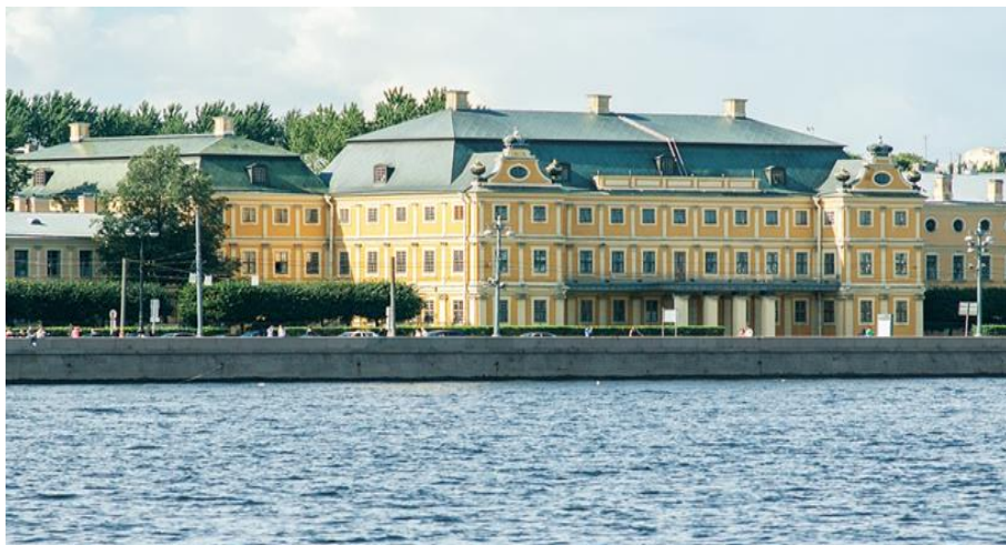
Рис. 4. Кадетский корпус 1731 г.

Осуществлялась активная поддержка российских мануфактурщиков и промышленников. В 1731 году был издан указ, который освобождал фабрикантов и мастеровых от служебных повинностей, что значительно оживило промышленное производство. В ходе проведенных реформ увеличился экспорт железа и целого ряда продуктов питания (больше всего хлеба). Был издан специальный указ о «размножении» суконных фабрик, улучшались условия для металлургической деятельности (поощрение поиска новых месторождений ископаемых, строительства новых заводов). При Анне Иоанновне в России были ликвидированы внутренние таможи. За 10 лет правления Анны Иоанновны в России были построены 22 металлургических завода, экспорт железа увеличился в 4,5 раза, производство чугуна увеличилось с 633 тысяч до 1068 тысяч пудов, производство меди –