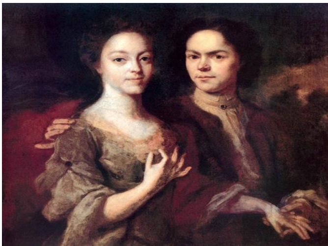
Рис. 16. Автопортрет с женой. Картина художника А. Матвеева. Холст, масло. Русский музей, Санкт-Петербург

«Автопортрет с женой» (1729). Это самая популярная работа Матвеева. Персонажи объединены взаимным уважением и внимательностью. Взгляд, выражение лиц, немного манерное, но оправданное прикосновение рук – все говорит об этой общности двух людей. Колорит живописи мягкий: желтоватый и красноватый. Впервые в русской живописи чувство было изображено так открыто и очень сдержанно.