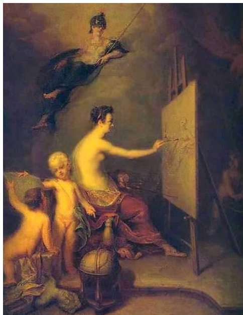
Рис.15. Аллегория живописи. Картина художника А. Матвеева. Русский музей

Андрей Матвеев (1701–1738). Учился в Голландии. Там познакомился с аллегорической живописью. После возвращения писал картины «Венера и Амур», «Аллегория живописи». Это было освоение еще никому не известного в России материала.