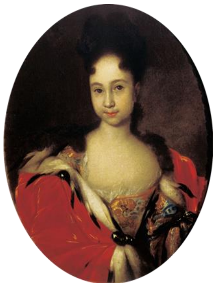
Рис. 14. Анна Петровна. Картина художника И. Никитина. Масло, холст. Москва, Третьяковская галерея

Иван Никитин (1680–1742) начинал в Москве с портретов сестры Петра Натальи Алексеевны, дочери царя Анны Петровны. Затем Никитин отправился в Италию, где познакомился с западной живописью. После Италии его работы стали отличаться удивительным мастерством и зрелостью. Взгляд художника на мир серьезен и объективен. В них чувствуется мастерство, умение передать внешнее сходство модели и выражение настроения.