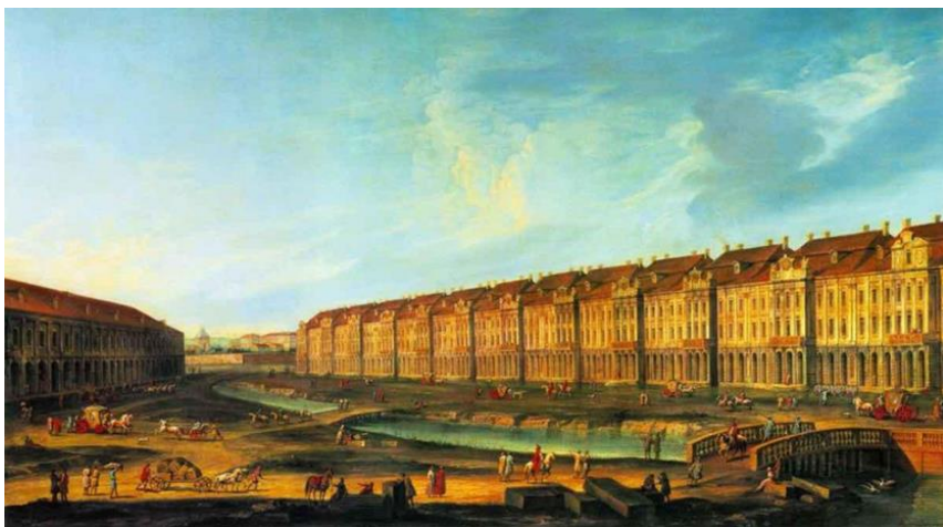
Рис. 7. Двенадцати коллегий здание в Санкт-Петербурге. Арх. Д.А. Трезини. 1722—1742. Неизвестный художник. Акварель. Третья четв. XVIII в.

Анна Иоанновна боготворила своего дядю Петра I, считая себя преемницей и продолжательницей «эпохи славных дел». Именно ей россияне должны быть благодарны за сохранение двух любимых детищ Петра Великого: Санкт-Петербурга и военно-морского флота. Петербург не пользовался особой популярностью у дворянства, а после смерти Екатерины I двор и во все переехал в Москву – новая столица начала приходить в запустение, полностью прекратилось строительство, здания с «образцовыми фасадами» внутри были холодны и пусты. «Дом Двенадцати коллегий», административный квартал на Васильевском острове, стоял недостроенным. Последовал «исход дворянства» в старую столицу – вслед за императором Петром II – подальше от сырости, наводнений, плесени.