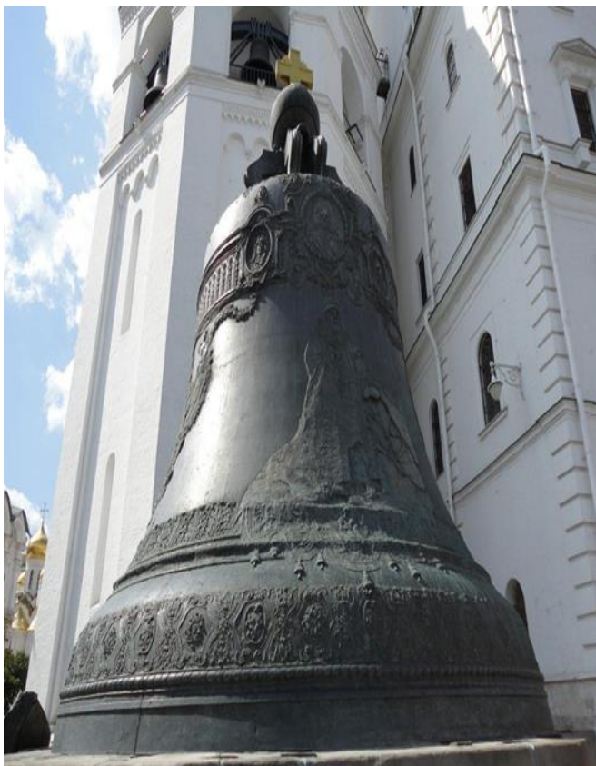
Рис. 6. Царь-колокол. Мастера Иван и Михаил Маторины

не смогли, и он пролежал на территории Кремля до времен Николая I. На нём укрепили памятную доску со следующим текстом: «Колокол сей вылит в 1733 году повелением Государыни Императрицы Анны Иоанновны. Пребыл в земле сто и три года и волею Благочестивейшего Государя Императора Николая I поставлен лета 1836 августа в 4 день».