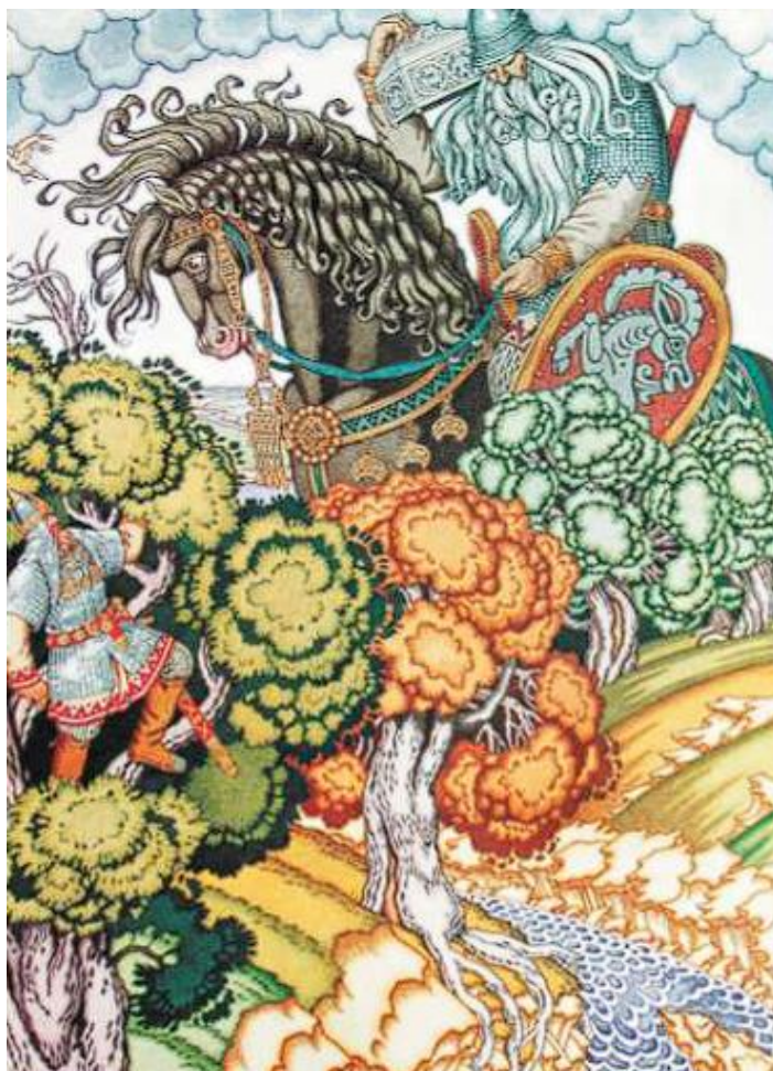
Илья Муромец и Святогор. Художник И. Я. Билибин