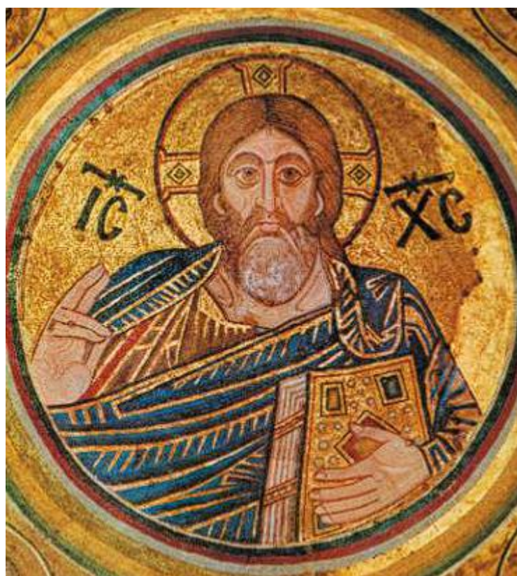
Христос Вседержитель. Мозаика из храма Святой Софии. Киев. XI век.