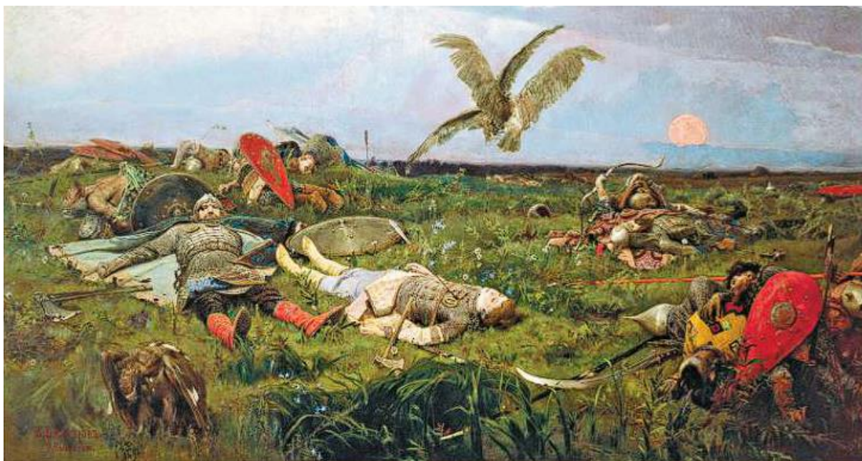
После побоища Игоря Святославича с половцами.