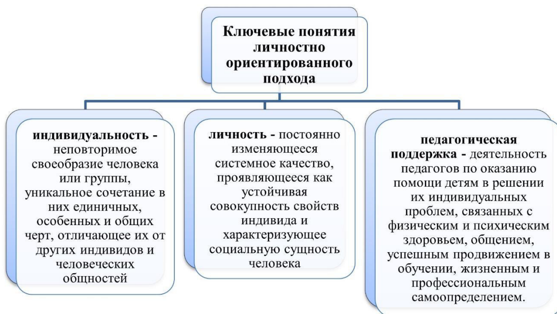
Рисунок 1 – Личностно-ориентированный подход

Компетентностный подход. Представляет собой комплексную систему, включающую определение образовательных целей; выбор содержания обучения; организационное обеспечение; технологическое сопровождение.