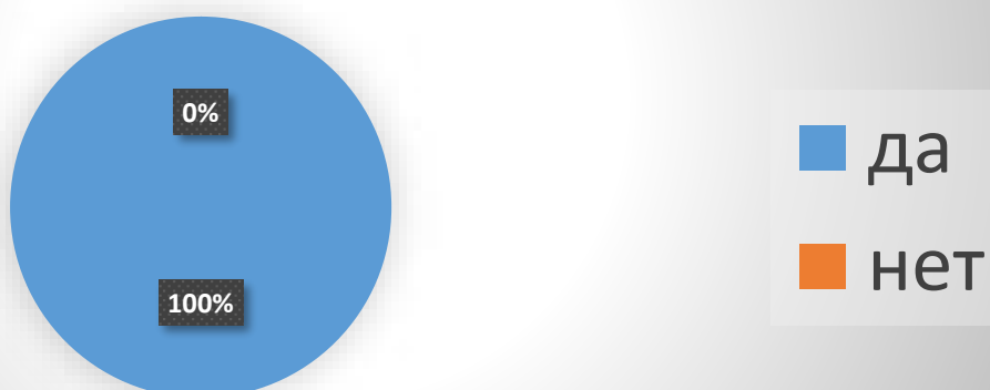
Рисунок 3 - Необходимо ли использовать различные актуальные педагогические формы и методы взаимодействия?

Необходимо ли использовать различные актуальные педагогические формы и методы?