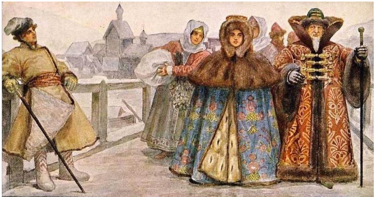
Фотография 5. Русская знать в XVII в. 55