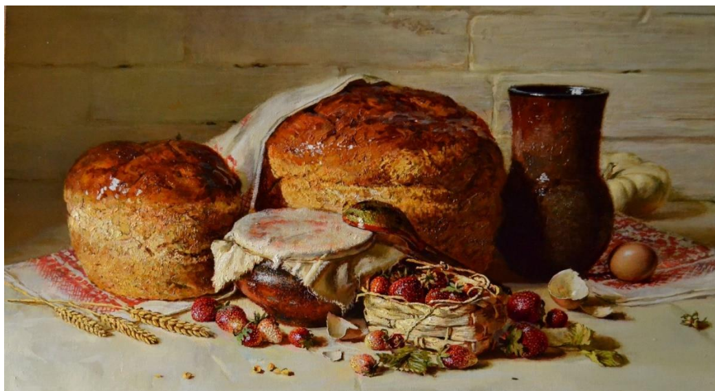
Фотография 1. Русский хлеб XVII в. 51