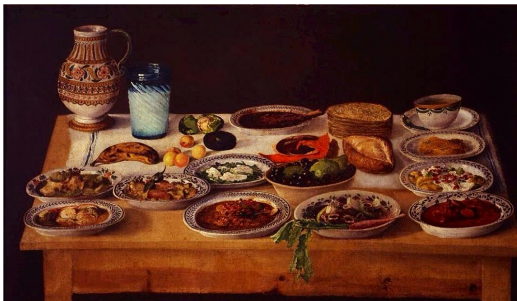
Фотография 2. Блюда русской кухни XVII в. 52