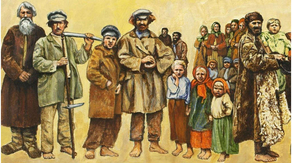
Фотография 4. Русские крестьяне в XVII в. 54