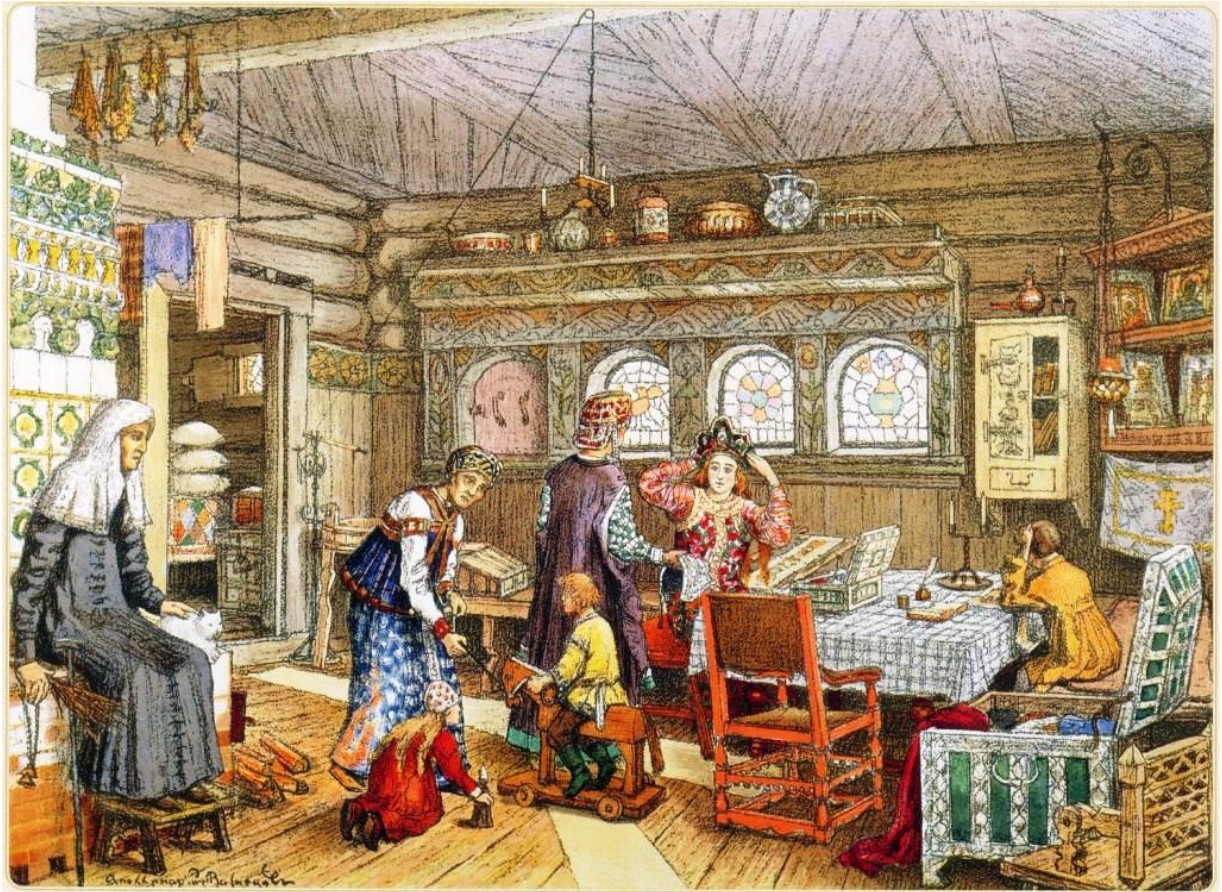
Фотография 3. Русский быт в XVII в. 53