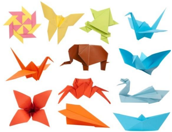
Рисунок 2. – Оригами