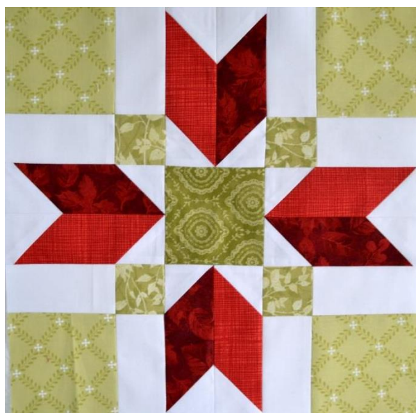
Рисунок 17. – Лоскутное шитье