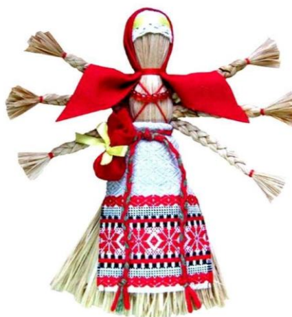
Рисунок 18. – Народные куклы