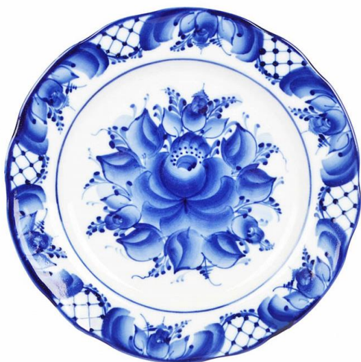
Рисунок 11. – Гжель