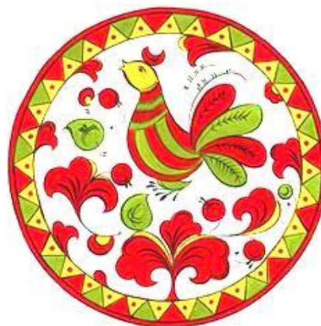
Рисунок 15. Пермогорская роспись