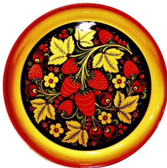
Рисунок 12. – Хохлома