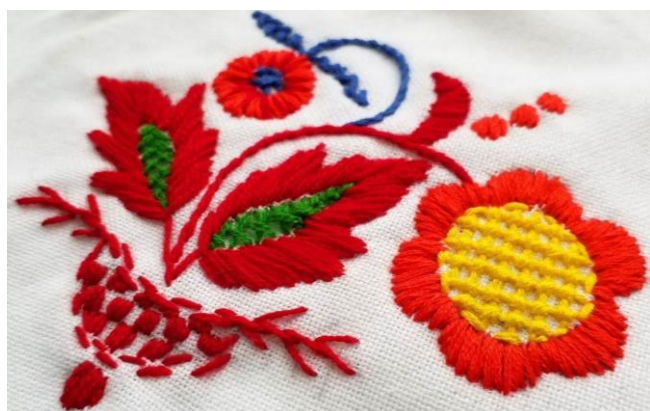
Рисунок 19. – Вышивка