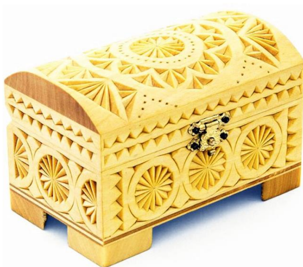
Рисунок 24. – Резьба по дереву