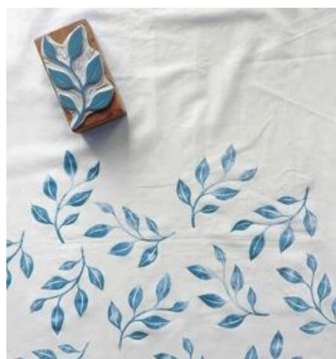
Рисунок 20. – Набойка по ткани