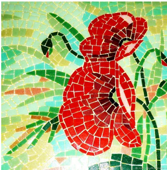
Рисунок 9. – Мозаика