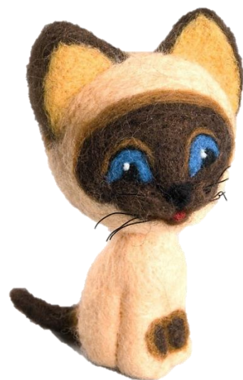
Рисунок 30. – Валяние