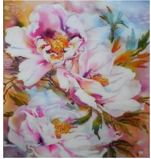
Рисунок 7. – Горячий батик