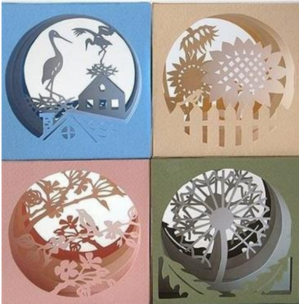
Рисунок 26. – Бумажный туннель