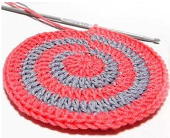
Рисунок 21. – Вязание крючком