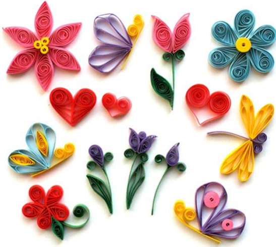
Рисунок 1. – Квиллинг