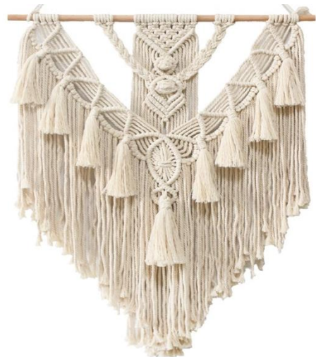
Рисунок 5. – Макраме