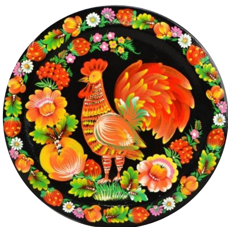
Рисунок 14. – Петриковская роспись