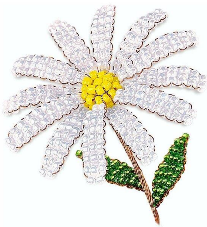
Рисунок 4. – Бисероплетение