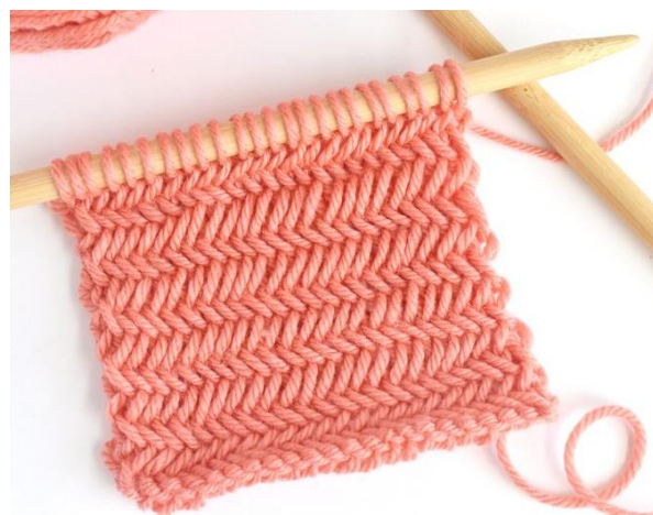
Рисунок 22. – Вязание спицами