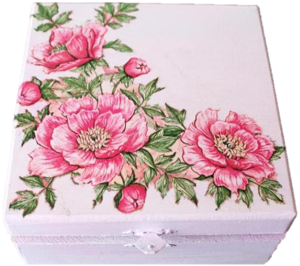
Рисунок 27. – Декупаж