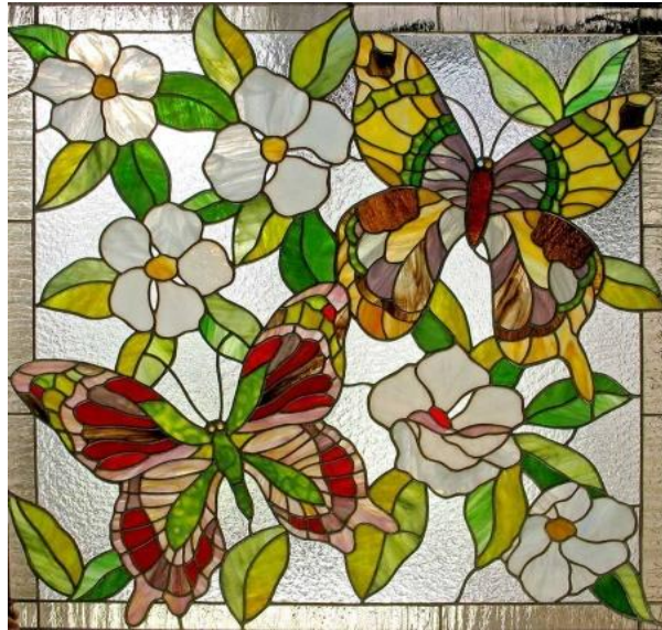
Рисунок 8. – Витраж