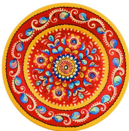
Рисунок 13. – Шенкурская роспись