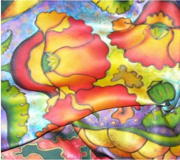
Рисунок 6. – Холодный батик