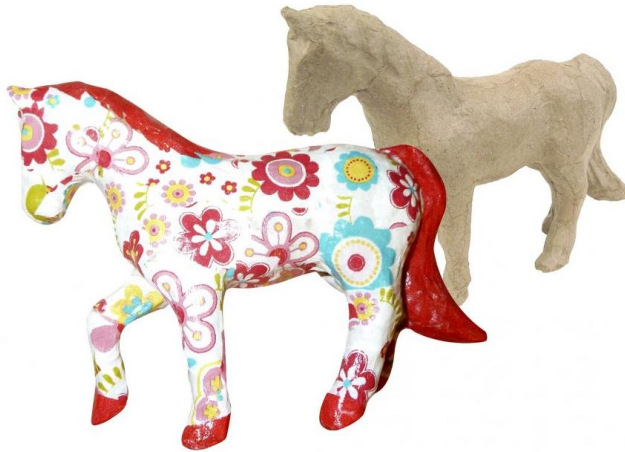
Рисунок 3. – Папье-маше