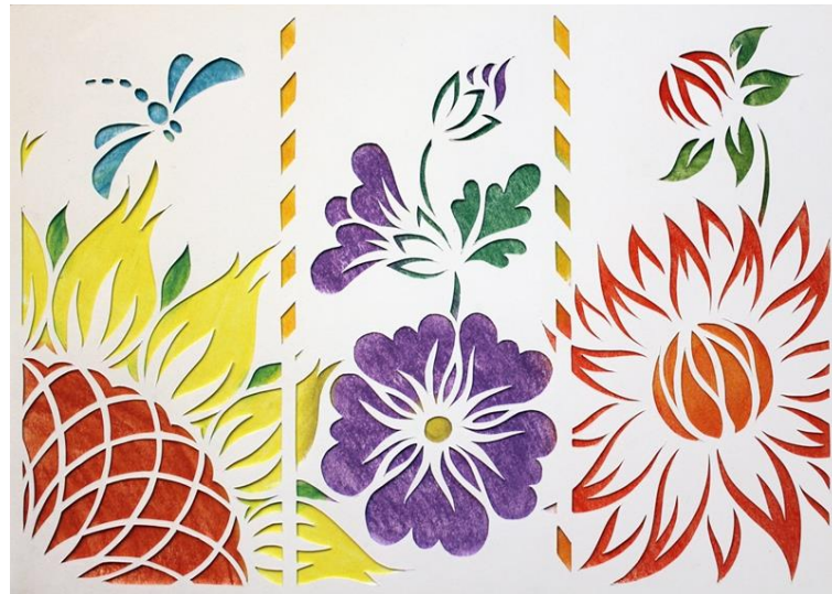
Рисунок 28. – Вытынанка