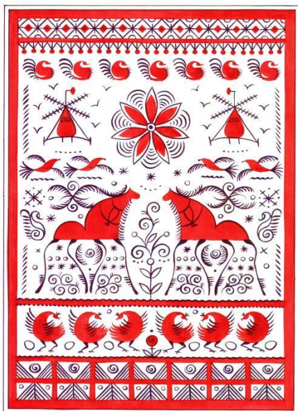
Рисунок 16. – Мезенская роспись