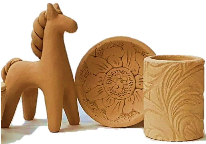
Рисунок 29. – Лепка