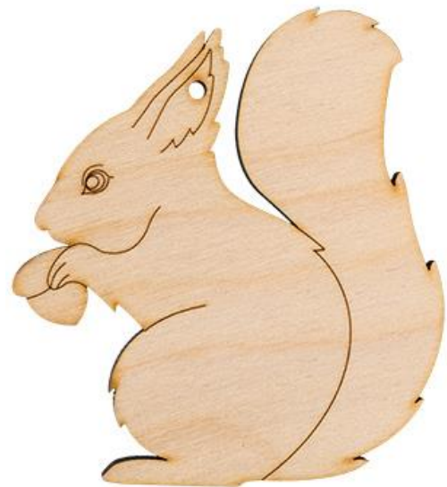
Рисунок 10. – Выпиливание