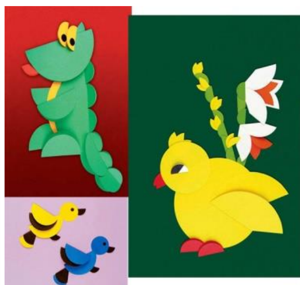
Рисунок 25. – Аппликация