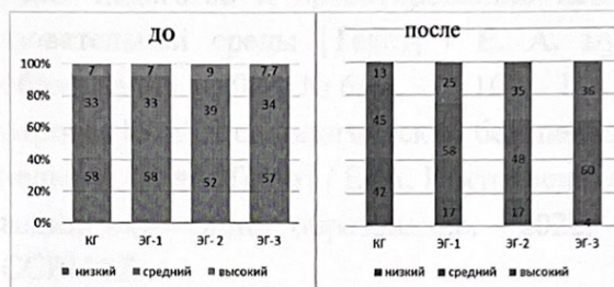
Рисунок 2. Результаты диагностики уровня готовности будущих педагогов к деятельности по проектированию ПБОС на констатирующем и обобщающем этапе опытно- экспериментальной работы

На контрольном этапе эксперимента выявлена положительная динамика роста уровня сформированности по всем критериям готовности, что подтверждено полученными величинами эмпирического значения х-квадрат при p \leq 0,01 (рисунок 2).