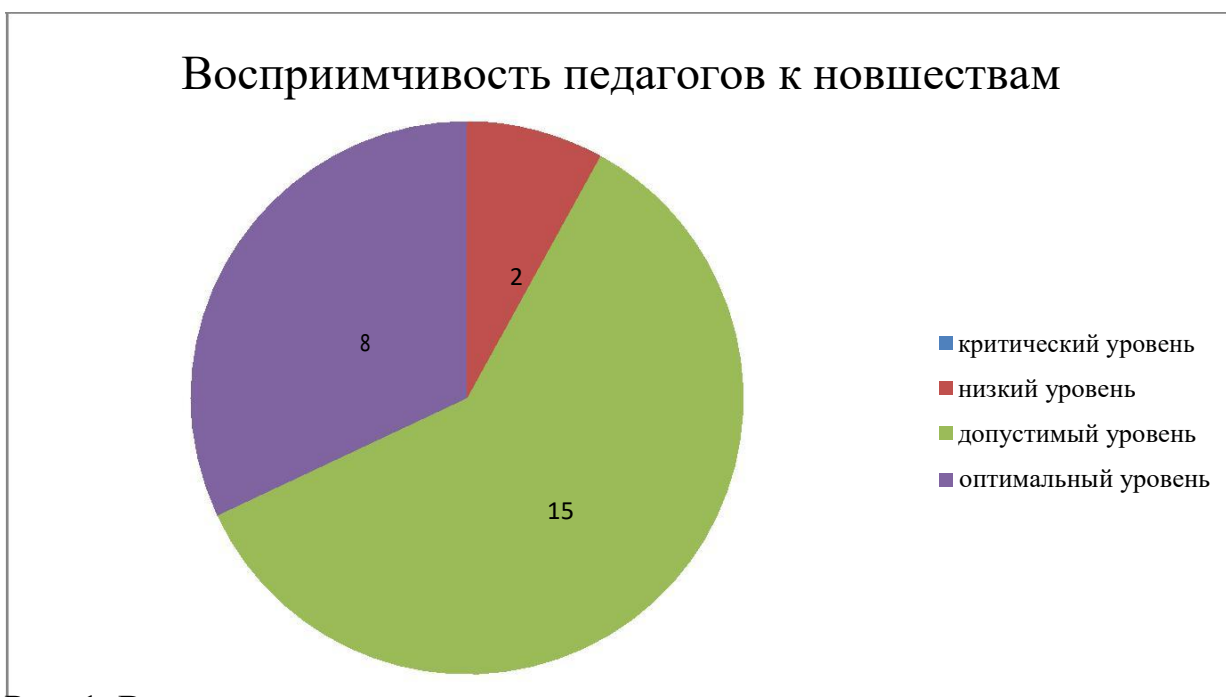
Рис. 1. Восприимчивость педагогов к новшествам

Результаты представлены на диаграмме (рис. 1).