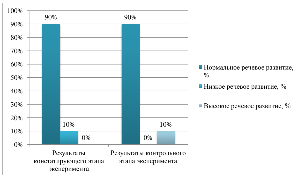
Рис.3. Сравнительные результаты изучения уровня речевого развития детей

По результатам диагностики можно констатировать, у дошкольников значительно повысился уровень речевого развития. На констатирующем этапе эксперимента 90% воспитанников имели нормальный уровень речевого развития, а 10% нормально низкое речевое развитие. Благодаря проведенной работе на формирующем этапе эксперимента, результаты речевого развития по результатам диагностики заметно возросли. Из результатов следует, что у 90% воспитанников показали нормальный уровень речевого развития, а 10% детей имеют высокий уровень речевого развития. Из этого следует, что у детей, имевших низкий уровень речевого развития на констатирующем этапе, уровень речи повысился до нормального. А также у 10% детей на контрольном этапе был выявлен высокий уровень речи, чего не наблюдалось на констатирующем этапе. Изучение результатов диагностики показало, что у детей повысился словарный запас, дети оперируют новыми словами, которые не употребляли на констатирующем этапе. Заметно улучшилась грамматическая сторона речи. Так же у некоторых воспитанников группы виден прогресс в использовании интонации голоса. У нескольких ребят замечено улучшение словообразования. В целом, у детей уходило меньше