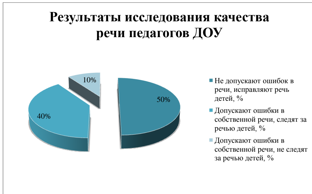
Рис.2. Результаты изучения качества речи педагогов (констатирующий этап эксперимента)

Результаты анкетирования наглядно представлены на рисунке 2.