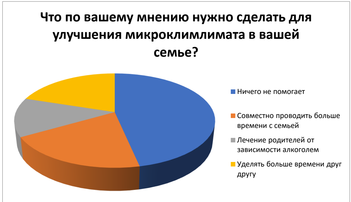
Рис. 10 – Как улучшить микроклимат в вашей семье.

Вывод: большинство опрошиваемых находят выход в уходе из дома, другие же наоборот пытаются помирить родителей