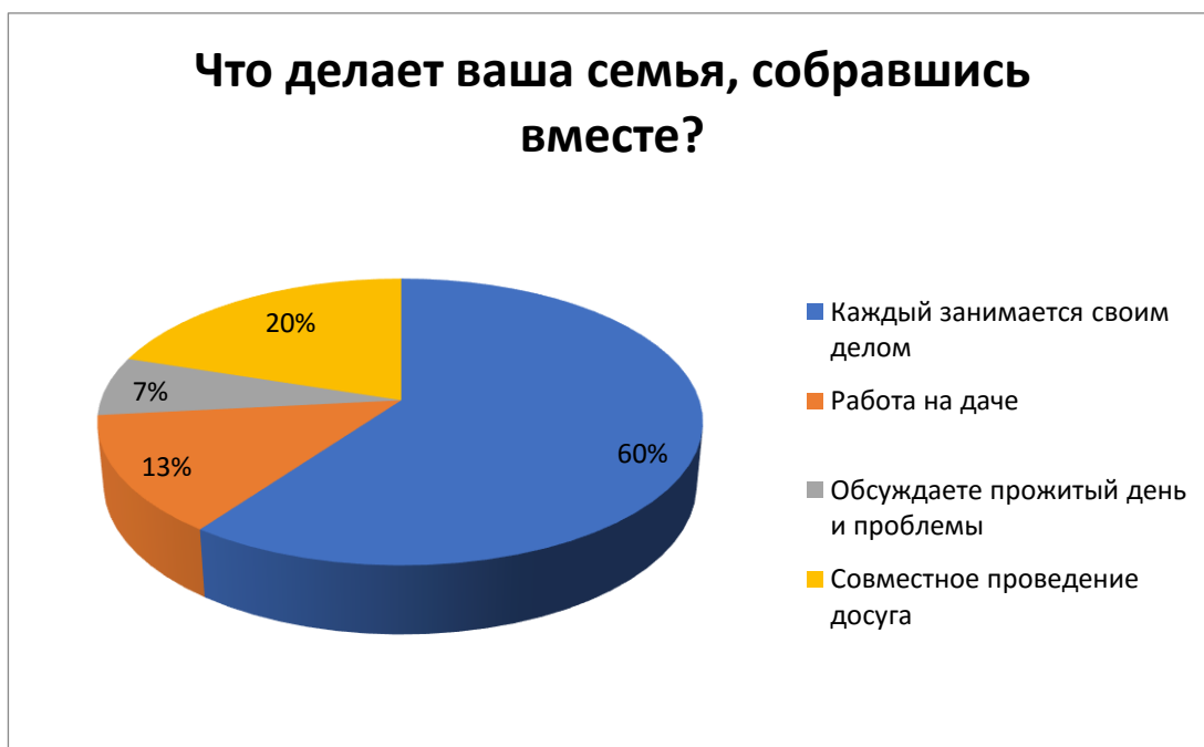
Рис.5 – Что делает ваша семья, собравшись вместе?

Вывод: большинство опрошенных отвечают, что их семья довольно редко собирается вместе, вторым по популярности ответом стали выходные дни и лишь 13 процентов опрошенных каждый день проводит время со своей семьёй.