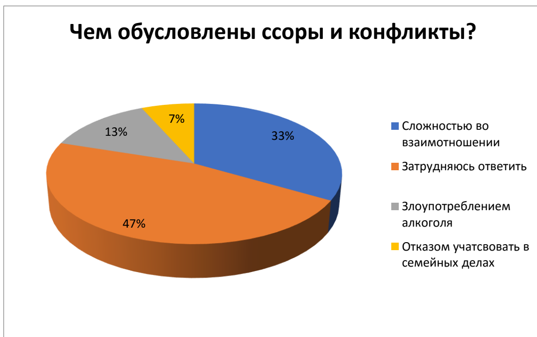
Рис.7 – Чем обусловлены конфликты?

Вывод: Практически во всех семьях опрошенных бывают конфликты.