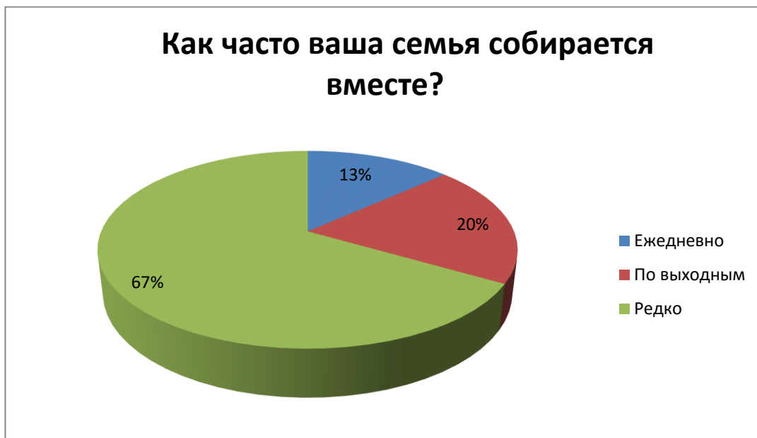
Рис. 4 – Как часто ваша семья собирается вместе?

Вывод: большинство опрошенных отвечают, что их семья довольно редко собирается вместе, вторым по популярности ответом стали выходные дни и лишь 13 процентов опрошенных каждый день проводит время со своей семьёй.