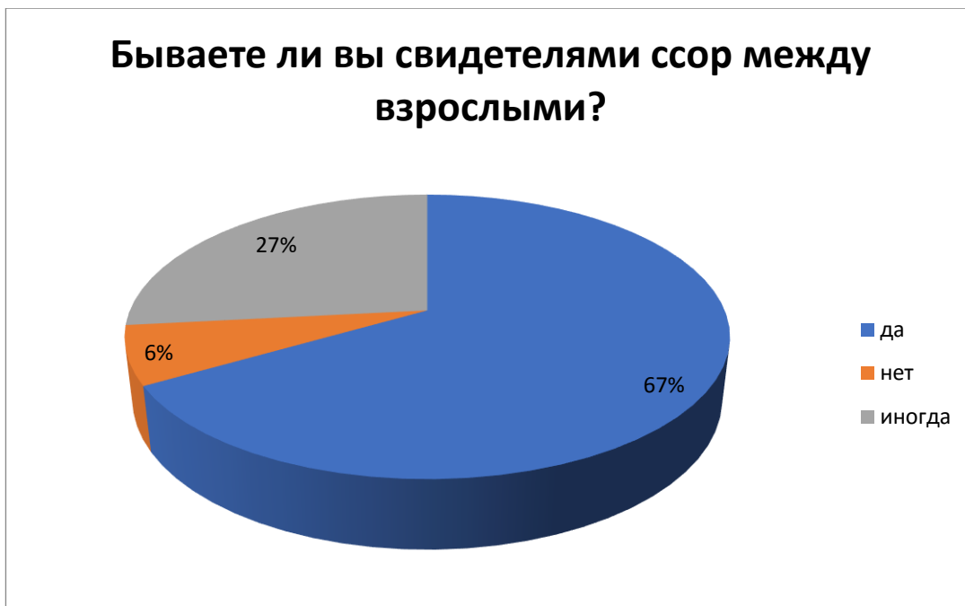
Рис. 8 – Бываете ли вы свидетелями ссоры между взрослыми?

Вывод: большинство опрошиваемых затрудняются ответить, либо не понимают причину ссор.