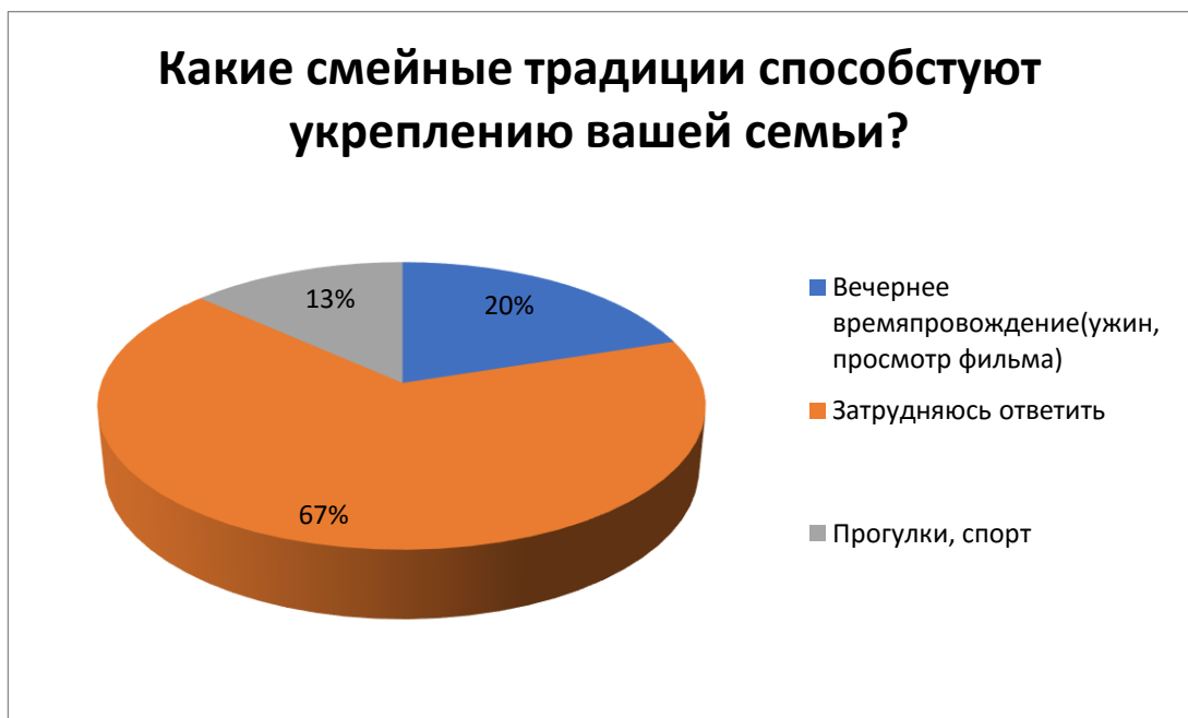
Рис. 3 – Какие семейные традиции способствуют укреплению вашей семьи?

Вывод: большинство опрошенных отвечают, что не смотря на отличные отношения в семье, считают её не совсем дружным коллективом.