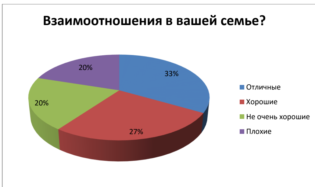
Рис. 1 – Взаимоотношения в семье

По результатам проведенного анкетирования были получены следующие данные, которые можно увидеть на представленных рисунках 1, 2, 3, 4, 5, 6, 7, 8, 9, 10.