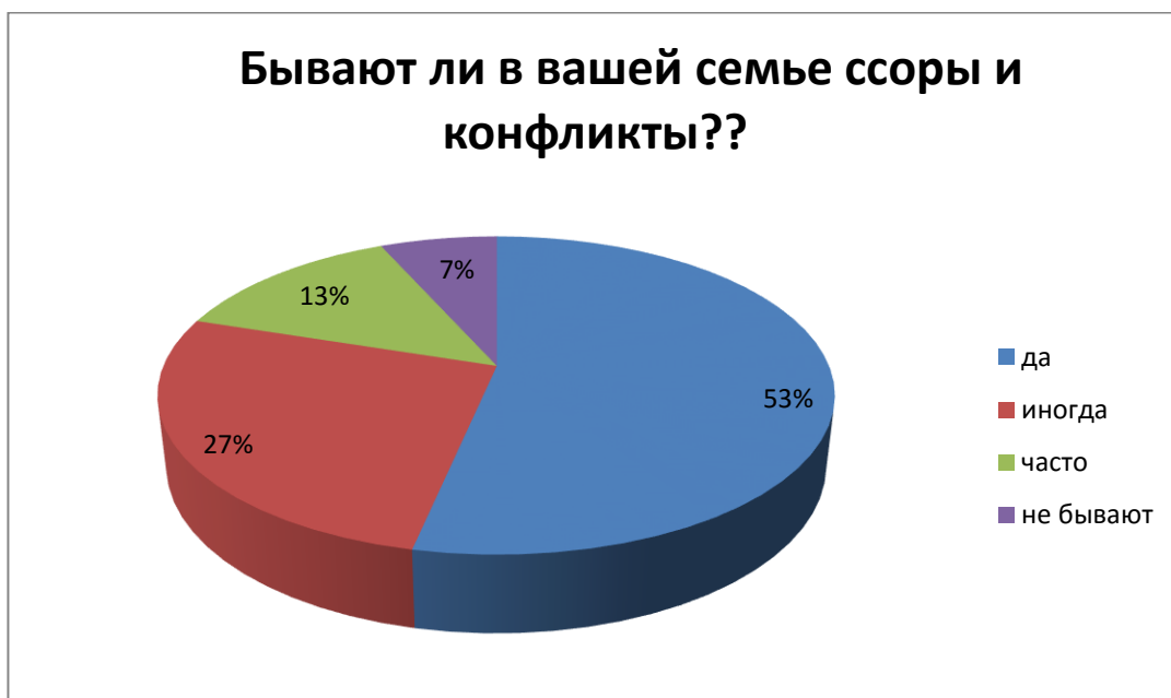
Рис.6 – Бывают ли в вашей семье ссоры и конфликты?

Вывод: Немногие из опрошиваемых проводят свободное время с семьей, большинство не вовлечены в досуговую семейную деятельность.