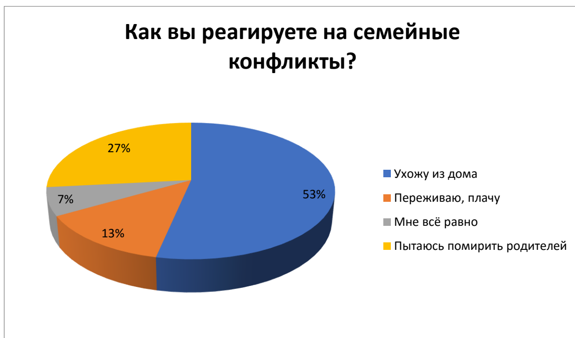
Рис. 9 – Как вы реагируете на семейные конфликты?

Вывод: большинство опрошиваемых были свидетелями ссор между взрослыми, лишь малый процент не встречался с конфликтами.