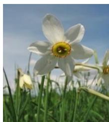
Рисунок 3 – Нарцисс узколиственный