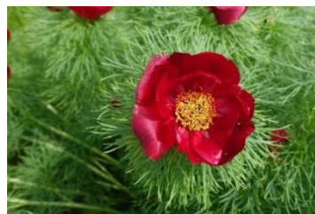
Рисунок 4 – Пион узколиственный