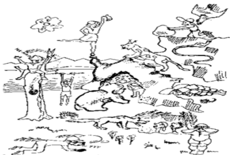
Рисунок 11 – Ущерб природе

14. «Знатоки природы» По очереди обучающимся включают для прослушивания голоса птиц и животных. Ребятам, необходимо определить, кому принадлежат данные голоса и записать названия в том порядке, в котором включались.