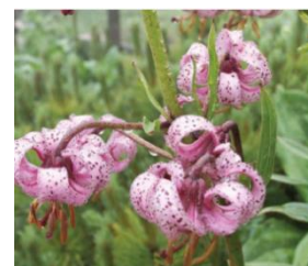
Рисунок 5 – Лесная лилия