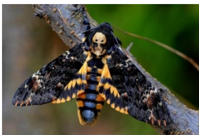
Рисунок 7– Бабочка мертвая голова