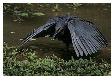
Рисунок 8 – Чёрная цапля

Почему многие растения и животные исчезли или стали редкими? Какие растения и каких животных вашей местности занесено в Красную книгу РФ?