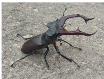
Рисунок 6 – Жук-олень