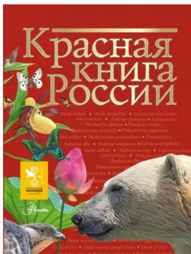
Рисунок 10 – Красная книга

Найдите информацию о растениях или животных РФ, находящихся под угрозой исчезновения. Подготовьте о них сообщения и поделитесь с одноклассниками и одноклассницами этой информацией. Предложите свои способы, которые помогут сохранить растения и животных на нашей планете.