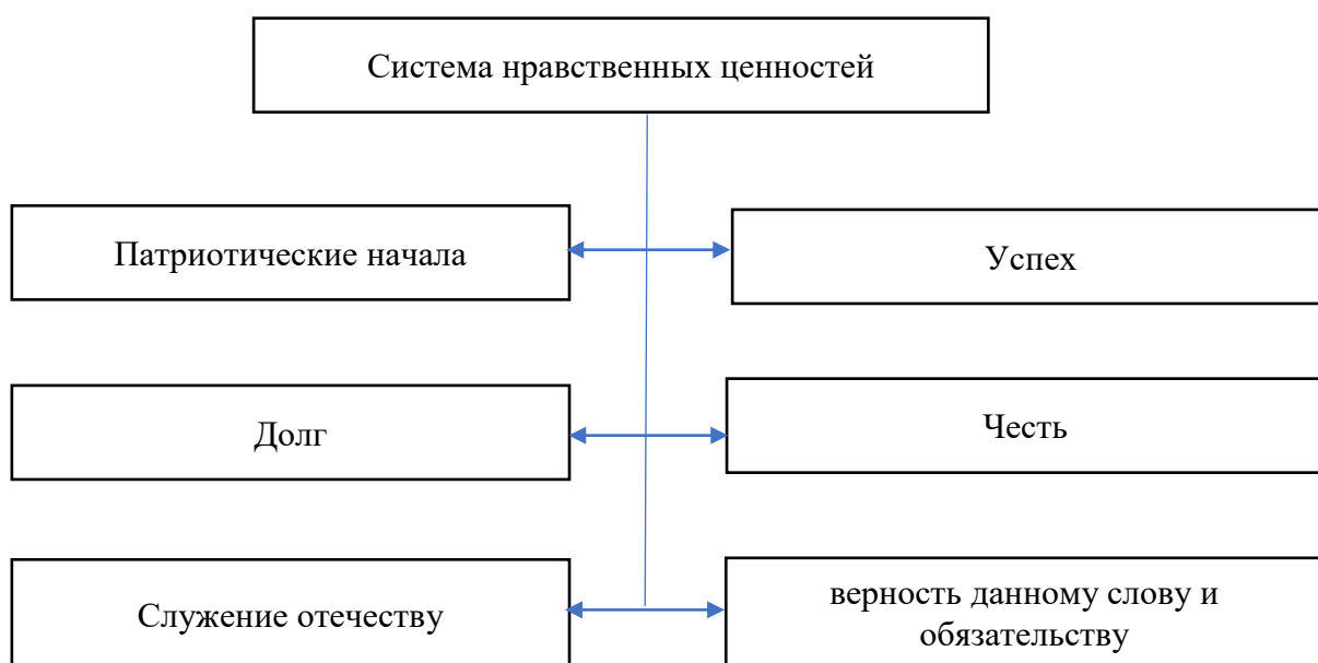
Рисунок 1. Система нравственных ценностей

Приведенную систему нравственных ценностей представляется возможным отразить в виде следующей схемы, представленной на рисунке 1.