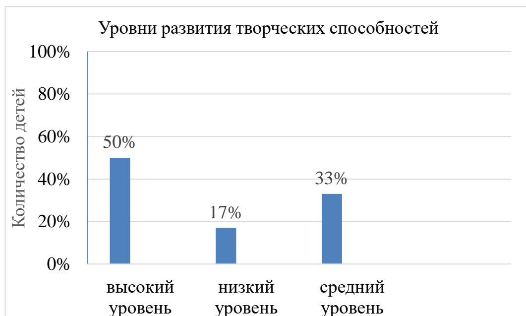
Рисунок 3 – Итоги контрольного этапа эксперимента