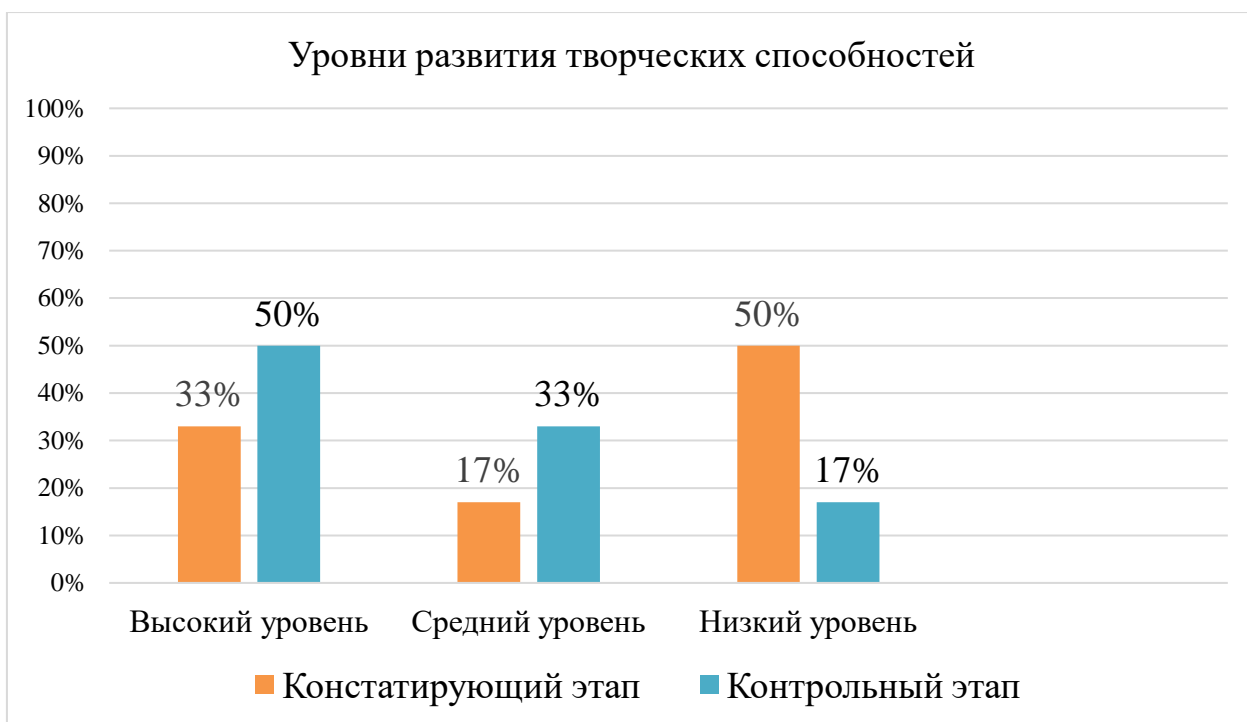
Рисунок 4 - Сравнительная диаграмма уровней развития творческих способностей старших дошкольников на констатирующем и контрольном этапах работы

В группу с низким уровнем развития творческих способностей отнесены (17%) – 1 ребенок, со средним уровнем (33%) – 2 дошкольников, с высоким уровнем развития творческих способностей (50%) – 3 ребенка. Для сопоставления уровней развития творческих способностей детей старшего дошкольного возраста на констатирующем и контрольном этапах работы представим сравнительную диаграмму (Рисунок 4).