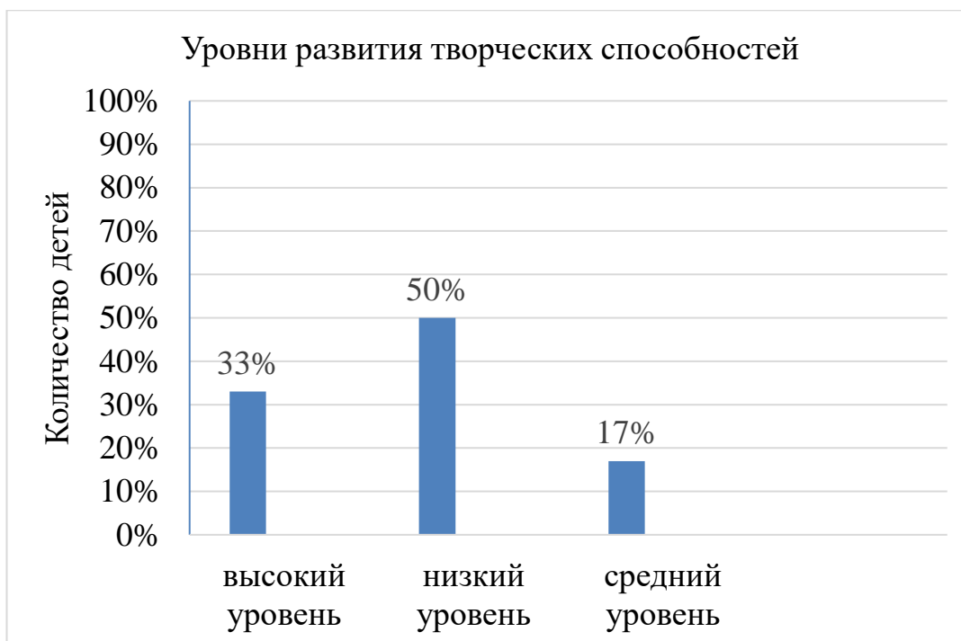
Рисунок 2 – Результаты обследования детей старшего дошкольного возраста с тяжелыми нарушениями речи по методике П. Торренса на констатирующем этапе работы

На рисунке 2 показано распределение старших дошкольников с тяжелыми нарушениями речи по уровням развития творческих способностей на констатирующем этапе работы.