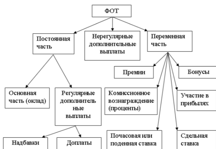
Рисунок 2. Элементы оплаты труда

Сдельная оплата труда – это форма оплаты труда, при которой ее размер непосредственно зависит от достигнутых результатов работы, выполнения норм выработки. Как правило, обладает физическими показателями, свидетельствующими о результатах (количество, площадь, объем и пр.). Может, но не обязательно, сочетаться с временными факторами работы (нормо-часы). Структурные элементы фонда оплаты труда работников (ФОТ) приведены на рисунке 2.