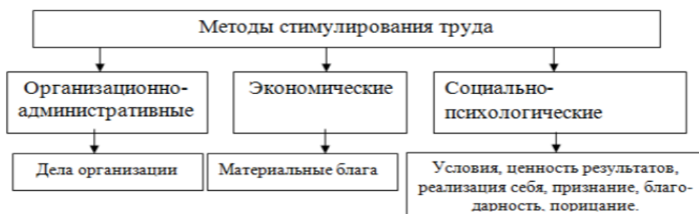
Рисунок 3. Методы и формы стимулирования труда

Организационно-административные методы предполагают, прежде всего, привлечение работников к участию в делах организации, работе коллегиальных органов: например, им предоставляется право голоса при решении ряда вопросов. Важную роль играет также стимулирование с перспективой приобрести новые знания и навыки. Она делает работников более независимыми, самостоятельными, придает им уверенность в завтрашнем дне. К данной группе также относится стимуляция обогащением содержания труда. Она заключается в предоставлении работникам более содержательной, важной, интересной, социально значимой работы, соответствующей их личностным интересам и склонностям, с широкими перспективами должностного и профессионального роста, а также позволяющей проявлять их творческие способности, осуществлять контроль над ресурсами и условиями собственного труда.