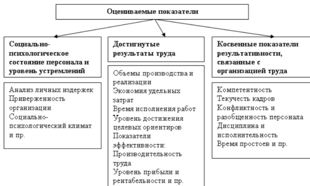
Рисунок 5. Система показателей оценки систем стимулирования

Исходя из формализации показателей оценки системы стимулирования инновационной деятельности педагога, они подразделяются на следующие группы: