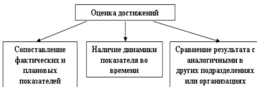
Рисунок 4. Подходы к оценке результативности систем мотивации

Второй подход к определению эффективности благодаря наличию возможностей более или менее точной оценки эффектов и затрат широко используется в практике хозяйствующих субъектов и находит свое отражение в системе показателей, количественно характеризующих эффективность их деятельности. Среди них можно выделить такие показатели как производительность труда, рентабельность и пр. Оценивать эффективность системы стимулирования педагога можно с нескольких позиций (рисунок 4).