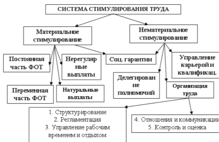
Рисунок 1. Элементы системы стимулирования и мотивации труда

Система стимулирования инновационной деятельности педагога представляет собой совокупность взаимосвязанных и взаимодополняющих стимулов, воздействие которых активизирует деятельность человека для достижения поставленных целей [54]. Общая схема элементов системы стимулирования педагогов представлена на рис. 1 и включает в себя элементы материального и нематериального стимулирования, а также занимающую промежуточное положение между ними систему социальных гарантий.