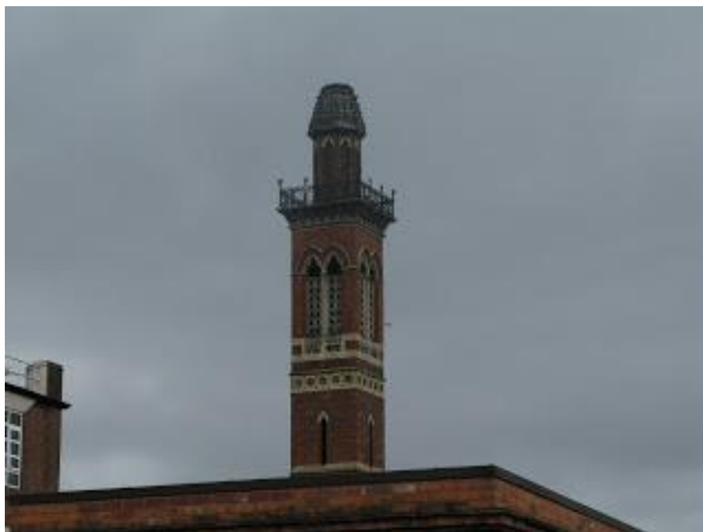
Рисунок 3 — Водопроводная башня «Эдгбастон» (Edgbaston)