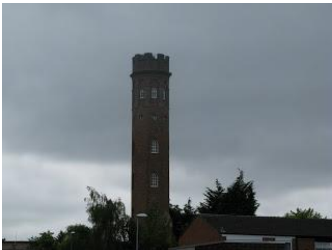
Рисунок 2 — «Безумие Перрота» (Perrott's Folly)