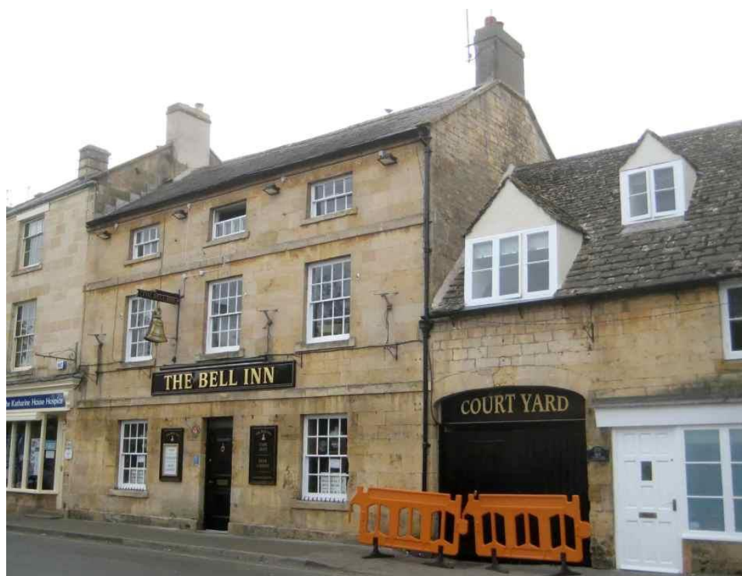
Рисунок 4 — Паb «Гарцующий пони» (The Prancing Pony)