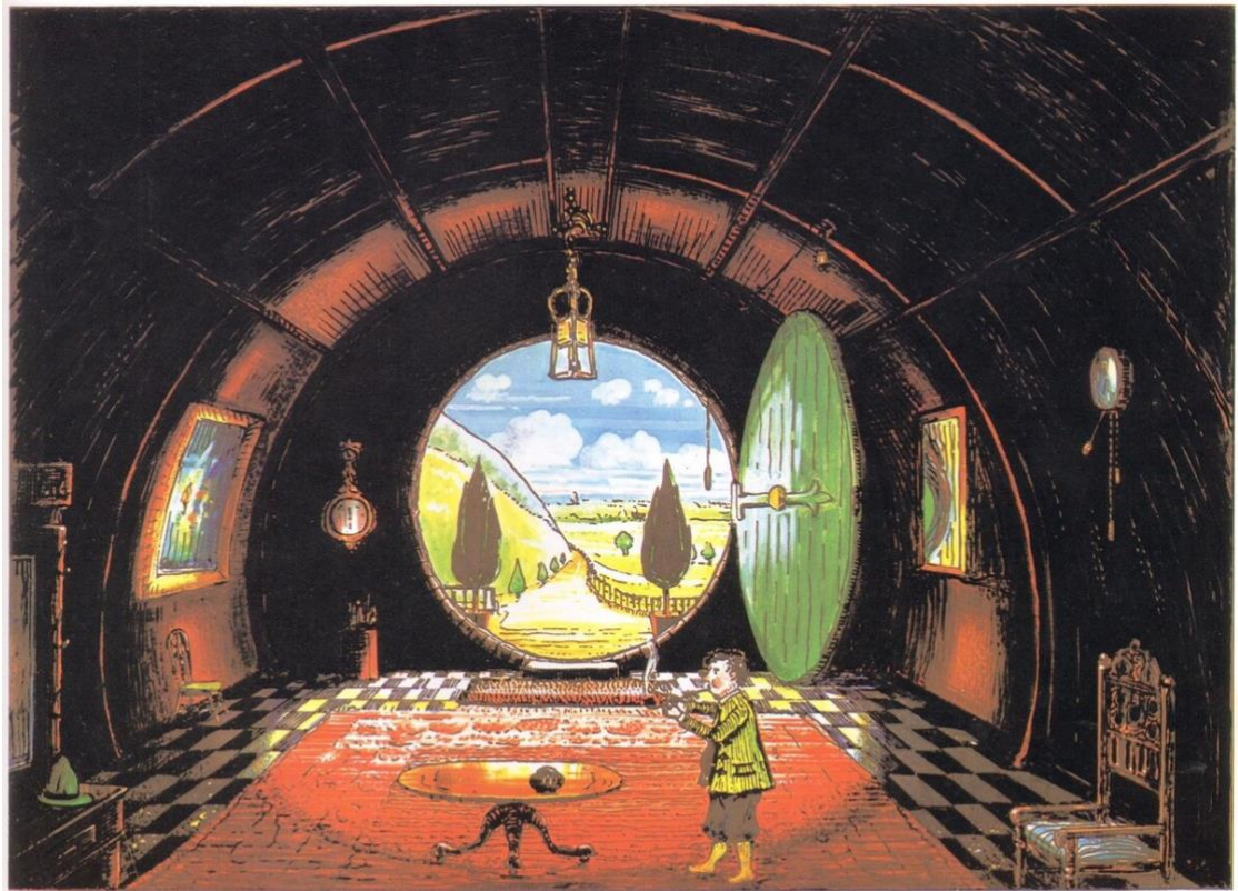
The Hall at Bag-End, Residence of B. Baggins Esquire