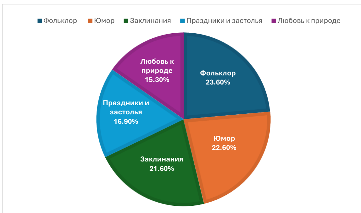
Рисунок 6. Контекстуальный анализ «Английская культурная идентичность»