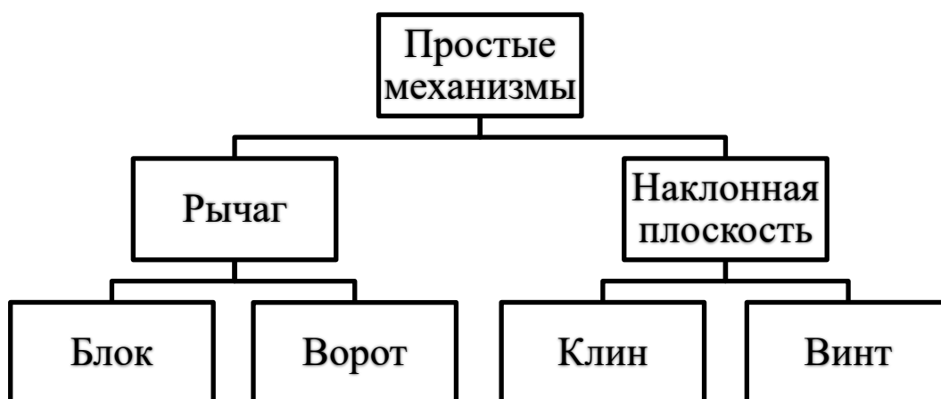
Рисунок – Простые механизмы

Примером рефлексии для 7 класса по теме «Простые механизмы» является заполнение схемы по пройденному материалу (рисунок).