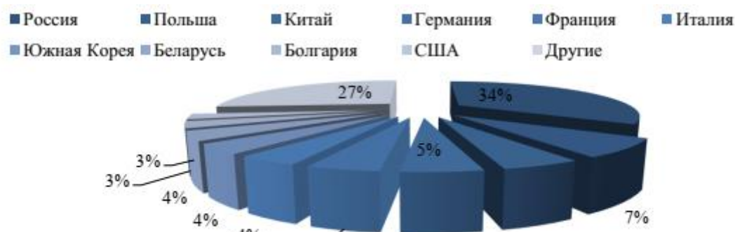
Рисунок 19. Топ-10 стран вузов-партнеров, ед.

Направления международного сотрудничества в сфере высшего образования могут быть следующими: