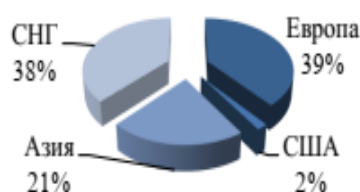
Рисунок 11. География распределения студентов казахстанских вузов по исходящей внешней академической мобильности за три квартала 2018 года, %.

Самая известная форма интернационализации высшего образования – это мобильность студентов. Современное вузовское образование дает студенту возможность во время обучения в своем вузе приобретать знания и практические навыки в зарубежном учебном заведении. Такая возможность стала реальной благодаря студенческой мобильности, которой в рамках Болонского соглашения уделяется большое внимание в ведущих российских и зарубежных вузах. Для большинства отечественных вузов студенческая мобильность является одним из важнейших направлений международной деятельности.