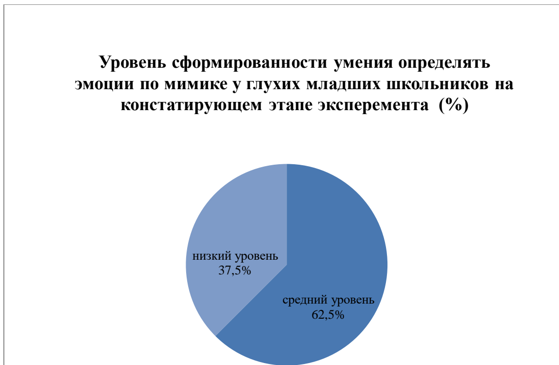
Рис. 1. Уровень сформированности умения определять эмоции по мимике у глухих младших школьников на констатирующем этапе эксперимента.

Результаты исследования по методике «Пиктограммы» представлены на рис. 1.