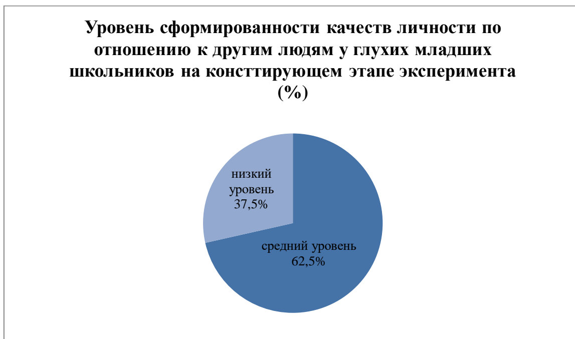
Рис. 2. Уровень сформированности качеств личности по отношению к другим людям у глухих младших школьников на констатирующем этапе эксперимента.

Результаты исследования уровня сформированности у ребенка качеств личности по отношению к другим людям по методике «Анкетирование учащихся» представлены на рис. 2.