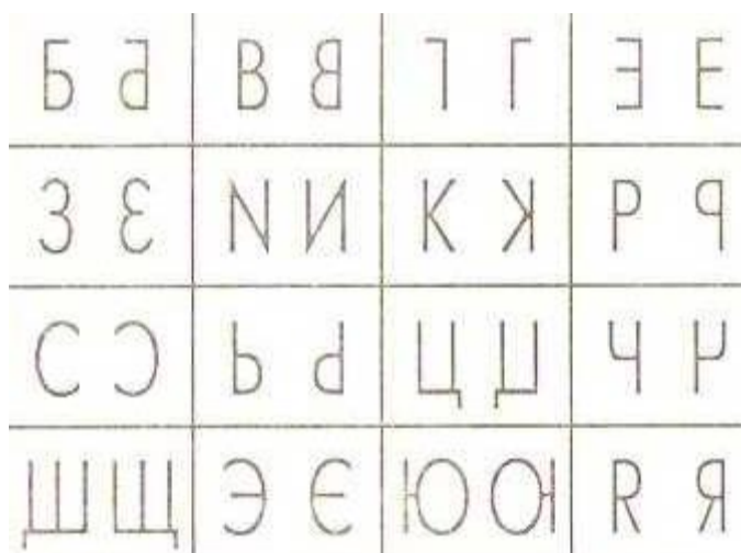
Рисунок 2. Задание «Зеркальные буквы»