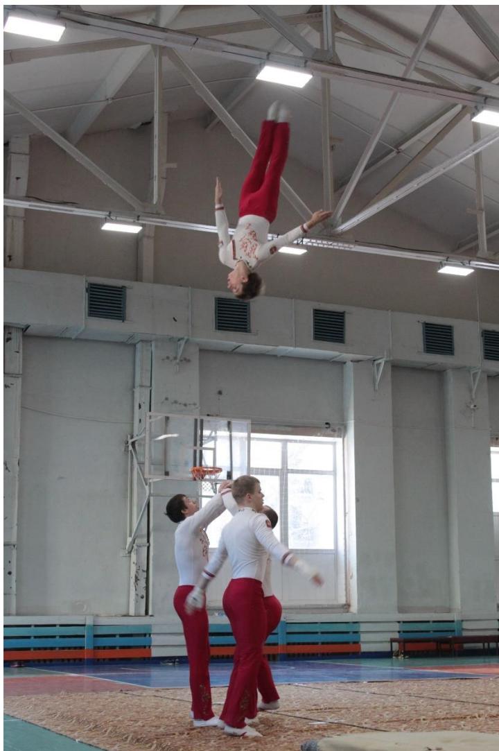
Фестиваль акробатики. Студенты-спортсмены в полёте