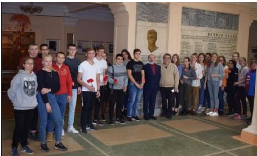
День учителя. Студенты-спортсмены колледжа у мемориала павшим