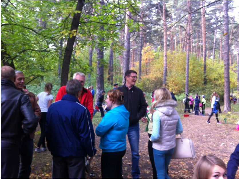
Золотая осень. В парке