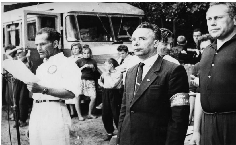
Штаб туристического слёта учащихся Челябинской области. 1964 г.