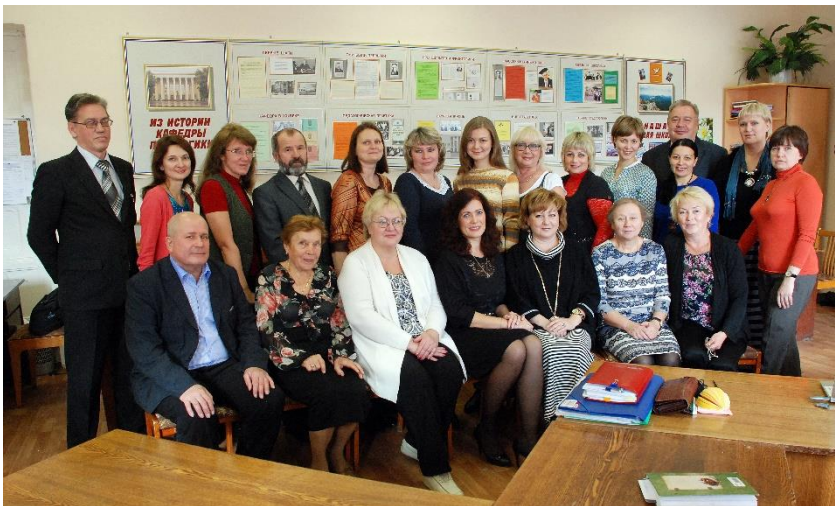
Кафедра педагогики-активный участник подготовки учителей физической культуры