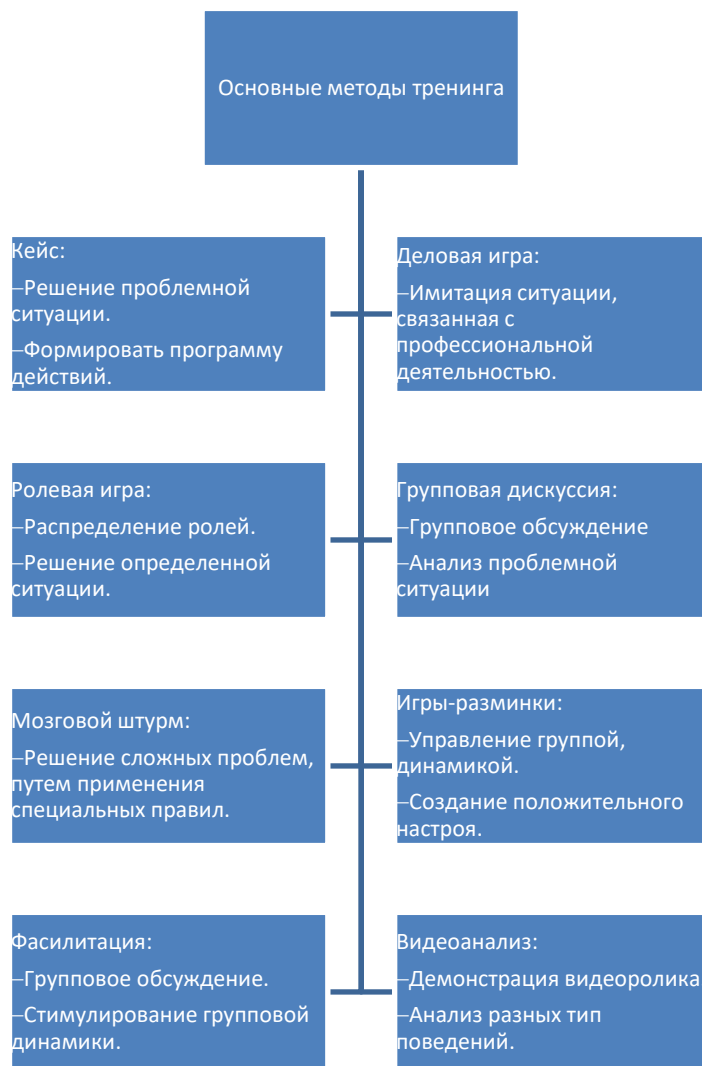
Рис. 1. Основные методы тренинга

Кейс – проблемная ситуация, требующая ответа и нахождения решения. Решение кейса может происходить как индивидуально, так и в составе группы. Основная задача кейса научиться анализировать информацию, выявлять основные проблемы и пути решения, формировать программу действий.