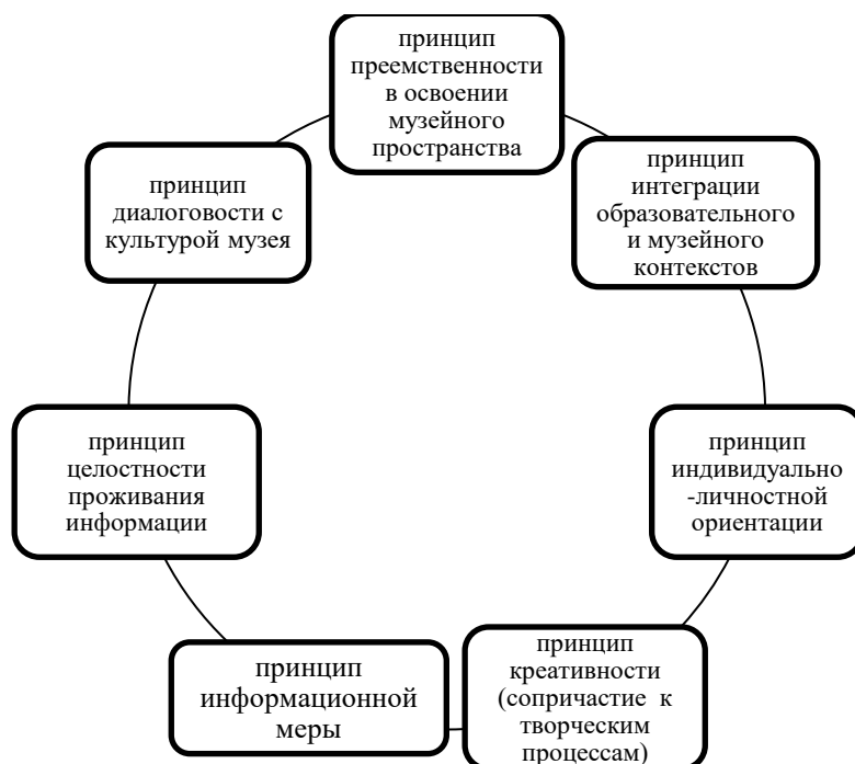
Рис. 1 Принципы педагогической деятельности в образовательном пространстве музея (по Е.М. Красновой)

эстетическому развитию детей дошкольного возраста в образовательном пространстве музея (Рис. 1).