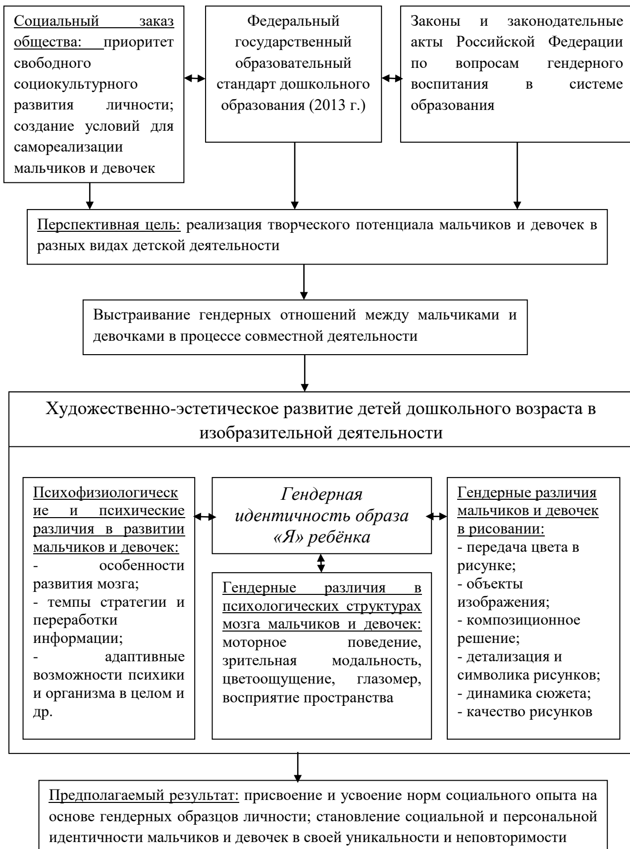
Рис. 5 Реализация гендерного подхода в художественно-эстетическом развитии детей дошкольного возраста