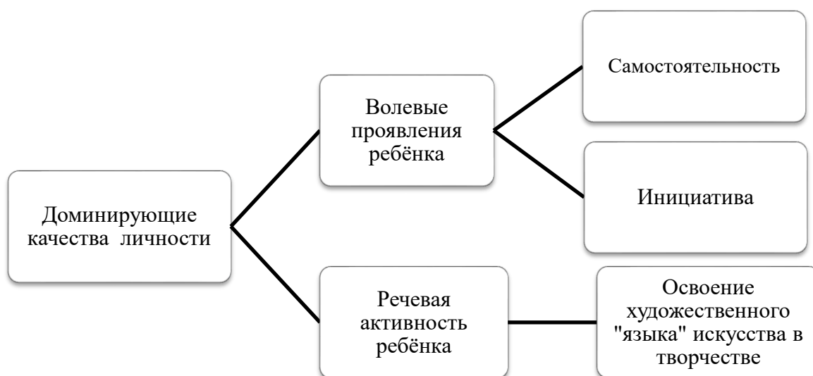
Рис. 3 Доминирующие качества личности в процессе самопрезентации продуктов художественно-творческой деятельности детей.

В процессе самопрезентации продуктов художественно-творческой деятельности детьми дошкольного возраста проявляются такие доминирующие качества личности как: волевые проявления, активность, самостоятельность, инициативность и пр. (Рис. 3).