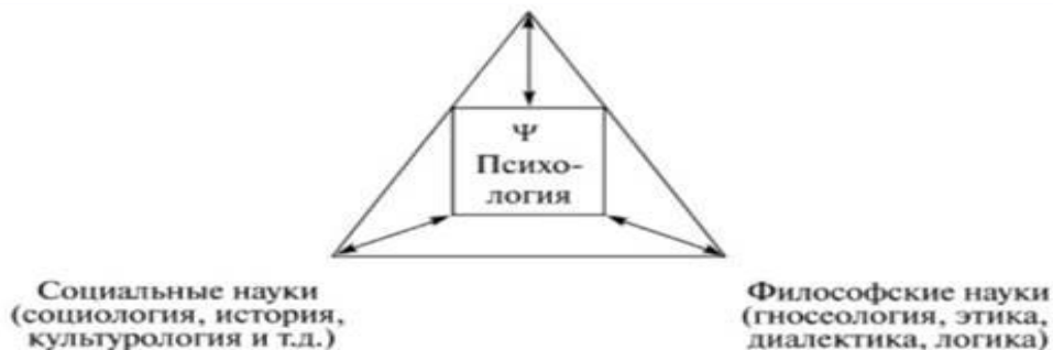
Рис.1. Место психологии в системе наук

Таким образом, психология является наукой, в которой соотносятся социально-гуманитарное и естественнонаучное знание, что определяет ее роль фундамента в системе наук. Психология интегрирует данные этих отраслей научного знания и, в свою очередь, влияет на них, становясь общей моделью человекознания. Историческая миссия психологии в современное время заключается в том, чтобы быть интегратором всех сфер человекознания и основным средством построения его общей теории. Психология выполняет миссию объединения естественных и общественных наук в изучении человека в единую концепцию.