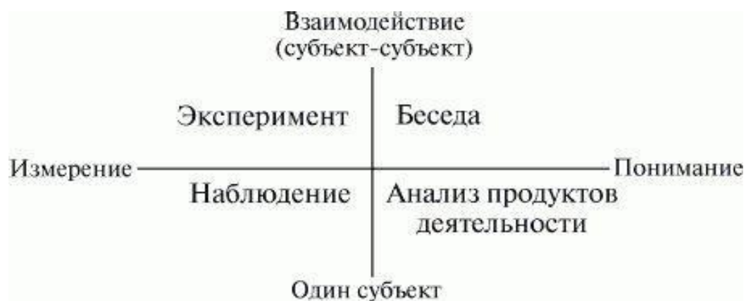
Рис.2. Эмпирические методы исследования по В.Н. Дружинину.

Взаимодействие максимально в клиническом эксперименте и минимально при самонаблюдении (когда исследователь и испытуемый – одно лицо); 2) объективированность и субъективированность процедуры. Крайними вариантами являются тестирование (или измерение) и «чистое» понимание поведения другого человека путем «вчувствования», эмпатии, сопереживания, личностной интерпретации его действий.