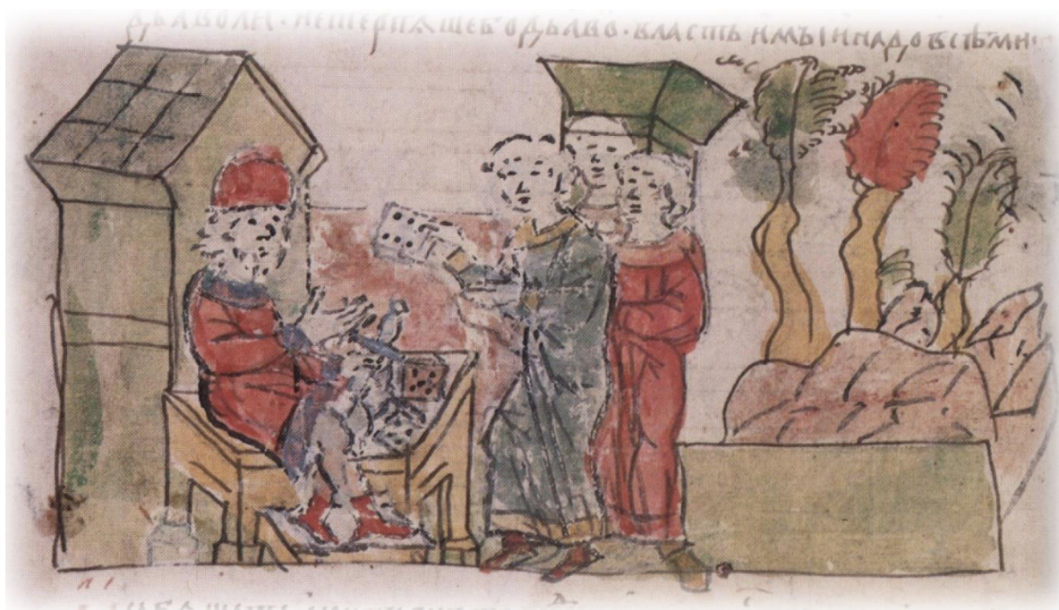
Метание жребия игральными кубиками боярами Владимира Святославича для определения жертвы языческим богам [3].