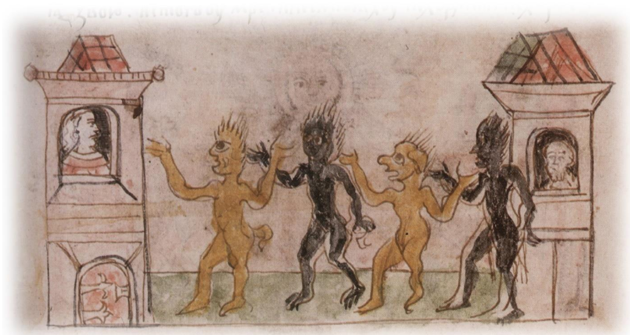
Аллегорическое изображение морового поветрия в Полоцке: бесы, готовые напасть в ночное время на людей, укрывшихся в домах [3].