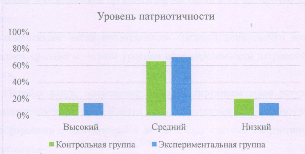
Рисунок 3 – Результаты сравнительного анализа диагностики уровня сформированности патриотических чувств

На рисунке 3 представлены результаты сравнения уровней сформированности патриотических чувств в контрольной и экспериментальной группах.