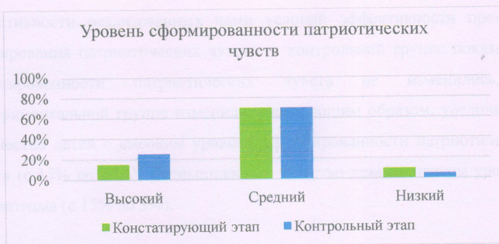
Рисунок 6 – Результаты сравнительного анализа этапов первичной и вторичной диагностики уровня сформированности патриотических чувств в экспериментальной группе

Как мы видим из рисунка 6, по итогам проведения формирующего этапа по реализации условий эффективности процесса патриотического воспитания средних дошкольников в экспериментальной группе, показатели сформированности основ патриотизма изменились. Так, увеличилось количество детей с высоким уровнем сформированности патриотических чувств (с 15 % до 25 %), уменьшилось количество детей с низким уровнем патриотизма (с 15 % до 5 %).