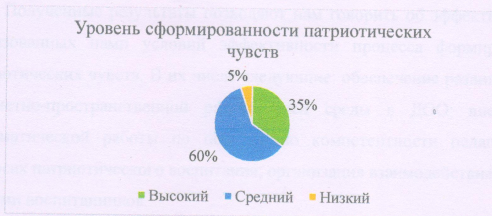
Рисунок 5 – Уровень сформированности патриотических чувств в экспериментальной группе

Наглядно данные представлены на рисунке 5.