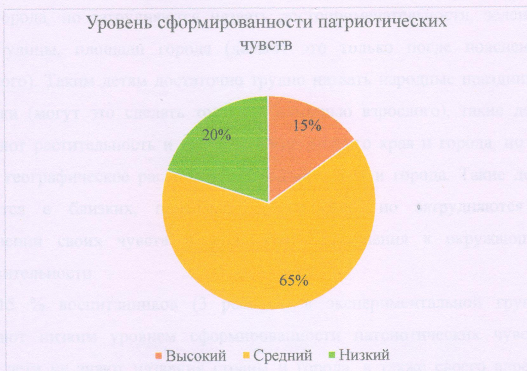
Рисунок 1 – Уровень сформированности патриотических чувств в контрольной группе

Наглядно результаты диагностики представлены на рисунке 1.