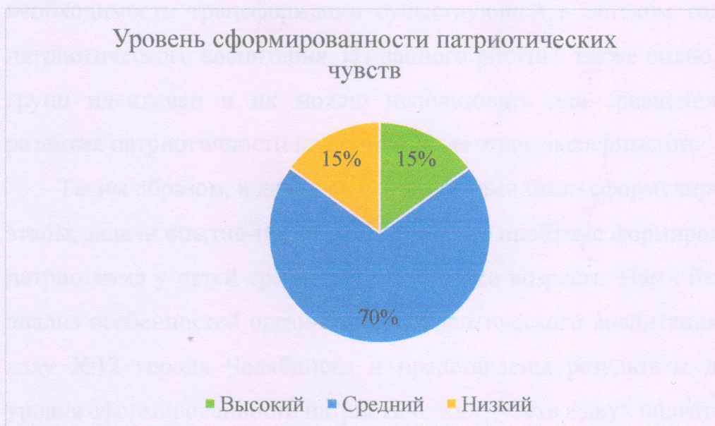
Рисунок 2 – Уровень сформированности патриотических чувств в экспериментальной группе

растительности, животном мире родного края и города. Результаты проведения ситуативных проб показали, что такие дети не проявляют заботы об окружающих и дружелюбия. Наглядно данные представлены на рисунке 2.