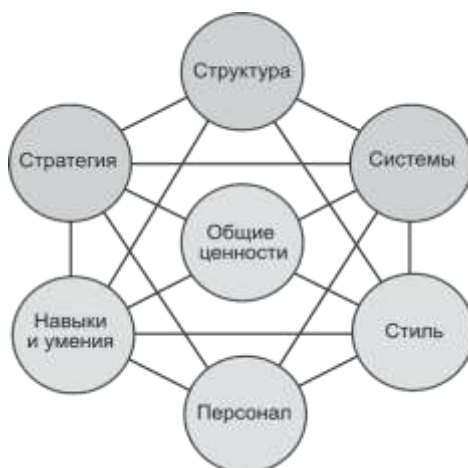
Рисунок 2 – Модель Маккинси 7S

Все элементы анализа делятся на «твердые» (легкоформализуемые) и «мягкие» (трудноформализуемые) S. Для наглядности структурирования данных составим следующую таблицу.