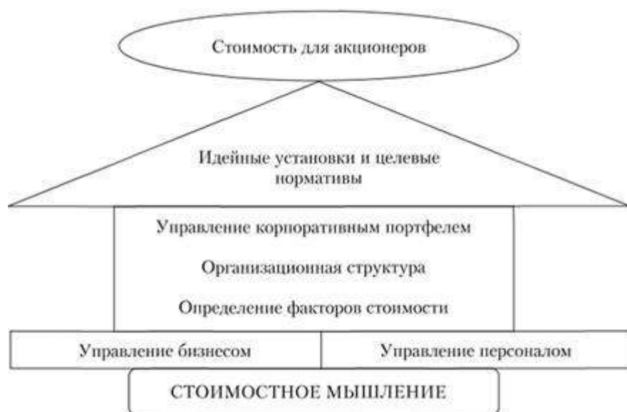
Рисунок 2 – Структура ценностного управления (по Т. Коупленду, Т. Коллеру, Дж. Муррину)

Как отмечают ряд авторов (Т. Коупленд, Т. Коллер, Дж. Муррин), в случае если в организации применяется концепция ценностного управления, то все действия этой организации должны базироваться на стоимостном мышлении, которое, в свою очередь, обуславливается наличием двух компонентов – системы измерения стоимости и стоимостной идеологии (рис. 2).